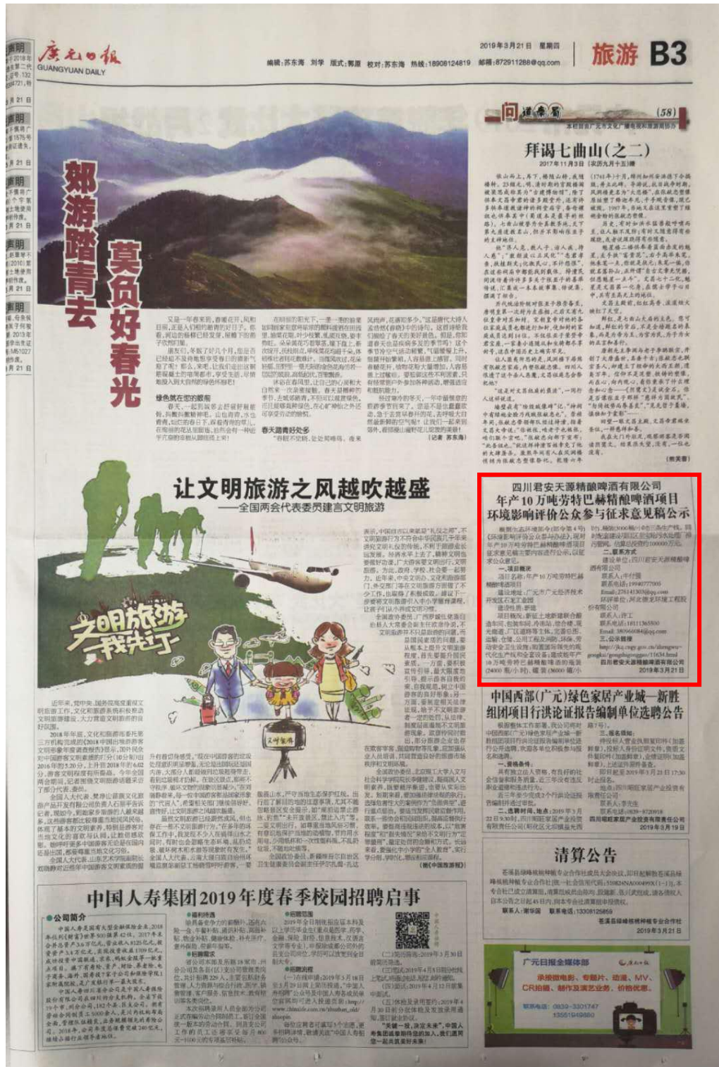
第一次报纸公示截图

建设单位分别于2019年3月21日、3月26日在广元日报上进行了征求意见稿公示，符合《环境影响评价公众参与办法》（生态环境部令第4号）中要求的通过建设项目所在地公众易于接触的报纸公开，且在征求意见的10个工作日内公开信息不得少于2次；报纸公示截图如下：