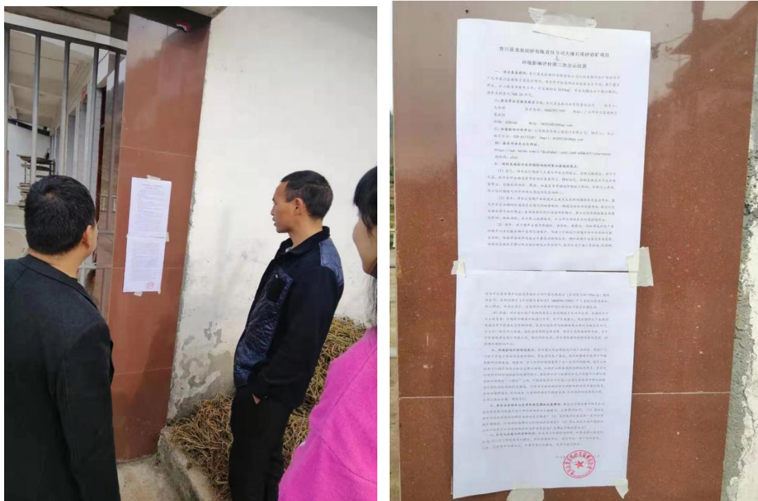
图 3-4 征求意见稿张贴公示截图