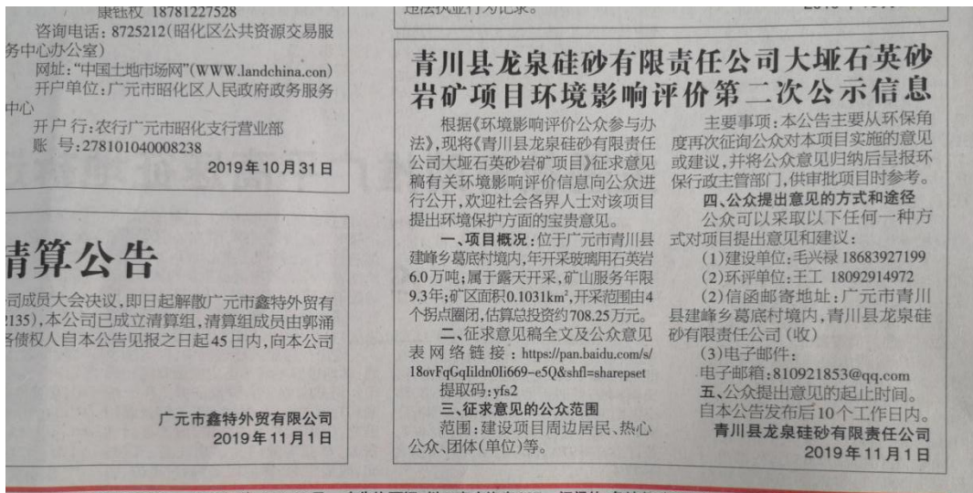
项目公示信息截图