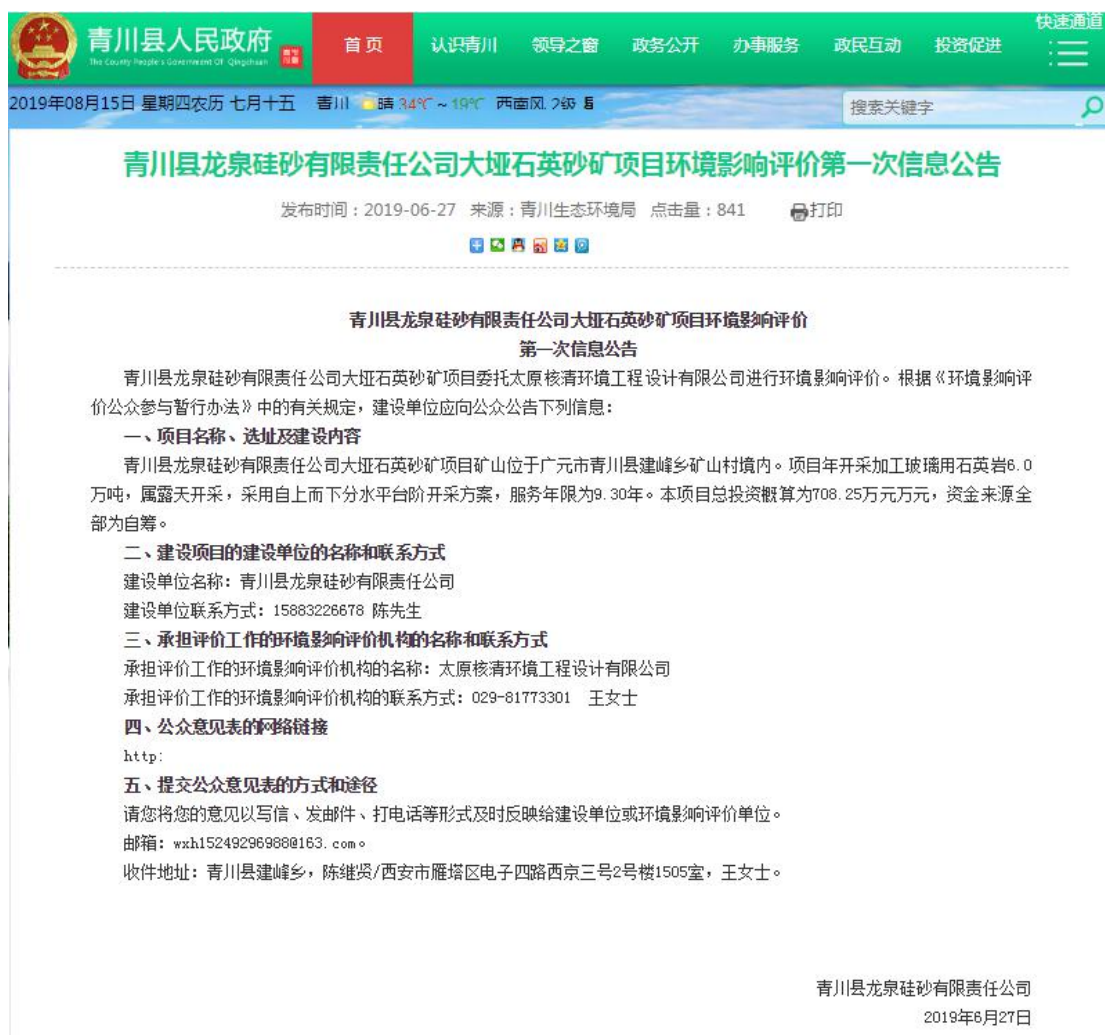
图 2-1 首次网络公示截图