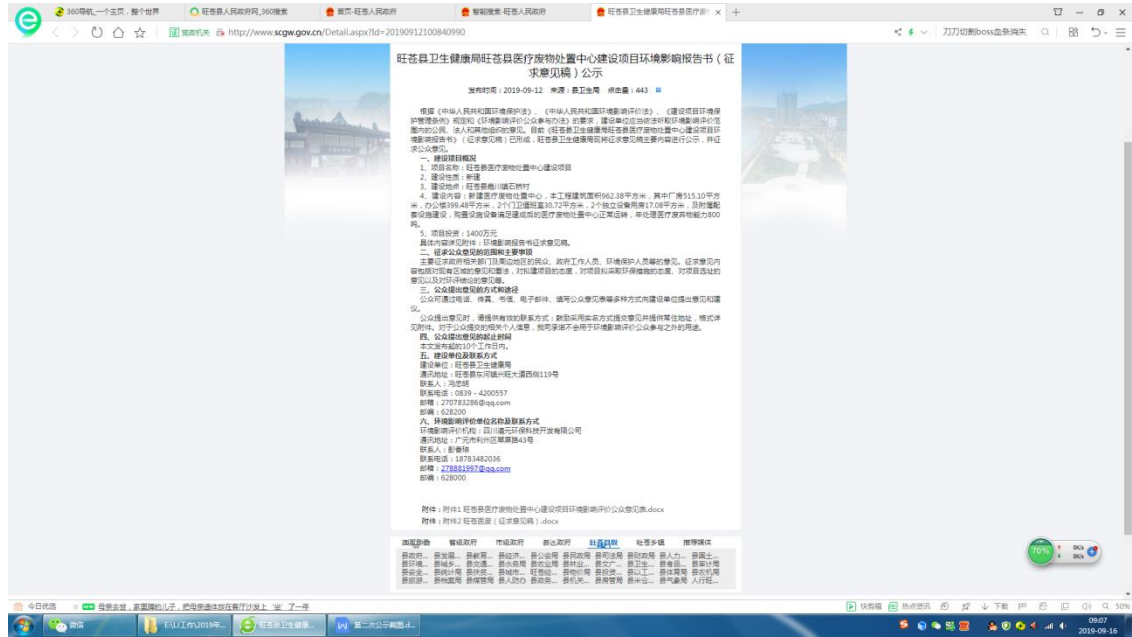
图 2 征求意见稿公示网页截图

该项目环境影响评价第二次网络公示选用载体满足《环境影响评价公众参与暂行办法》等相关要求，网址为： http://www.scgw.gov.cn/PubDetail.aspx?Id=20190912100502-28190-00-000 。网络公示截图见图 2-2。