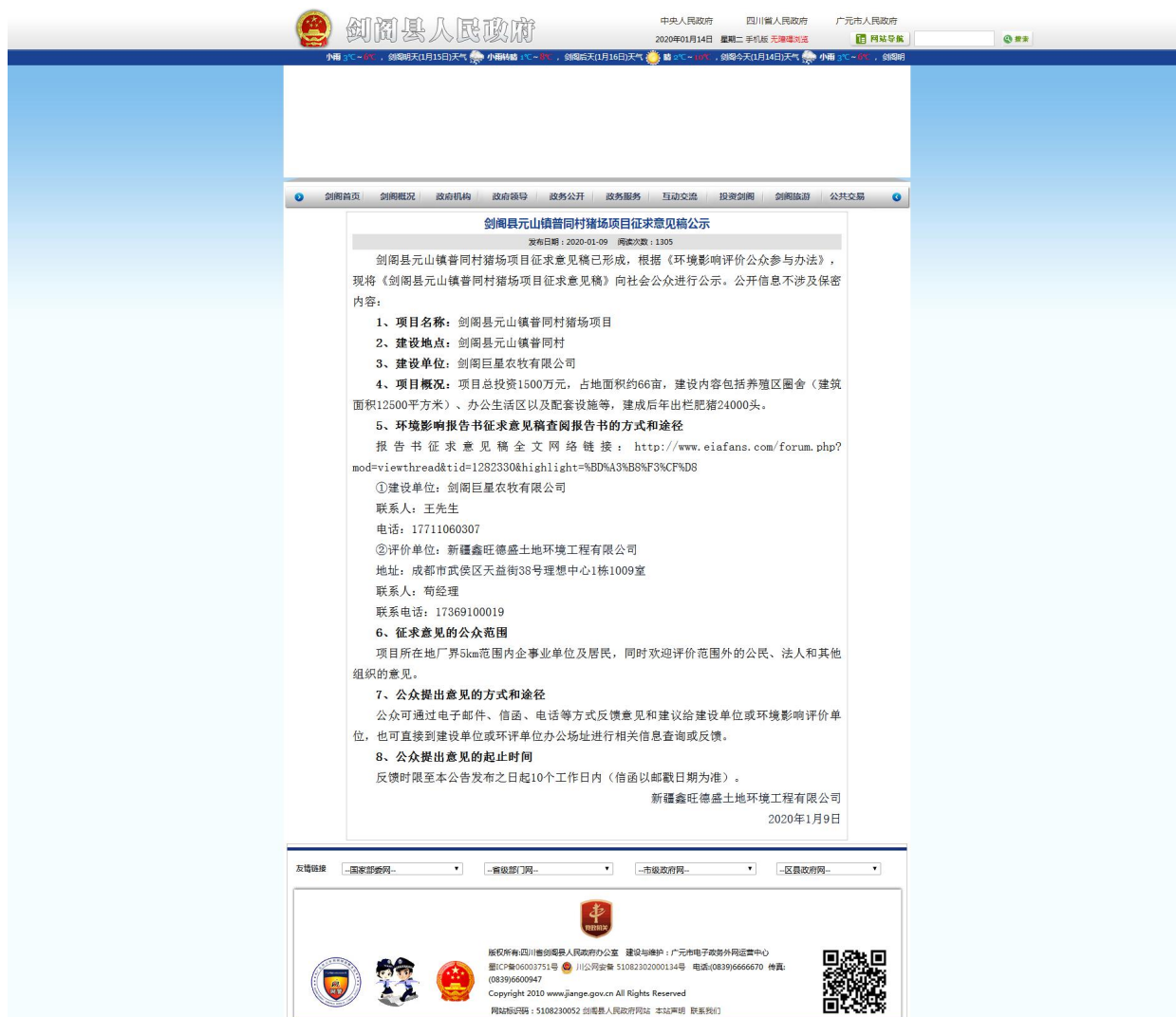
剑阁县人民政府网上公示截图