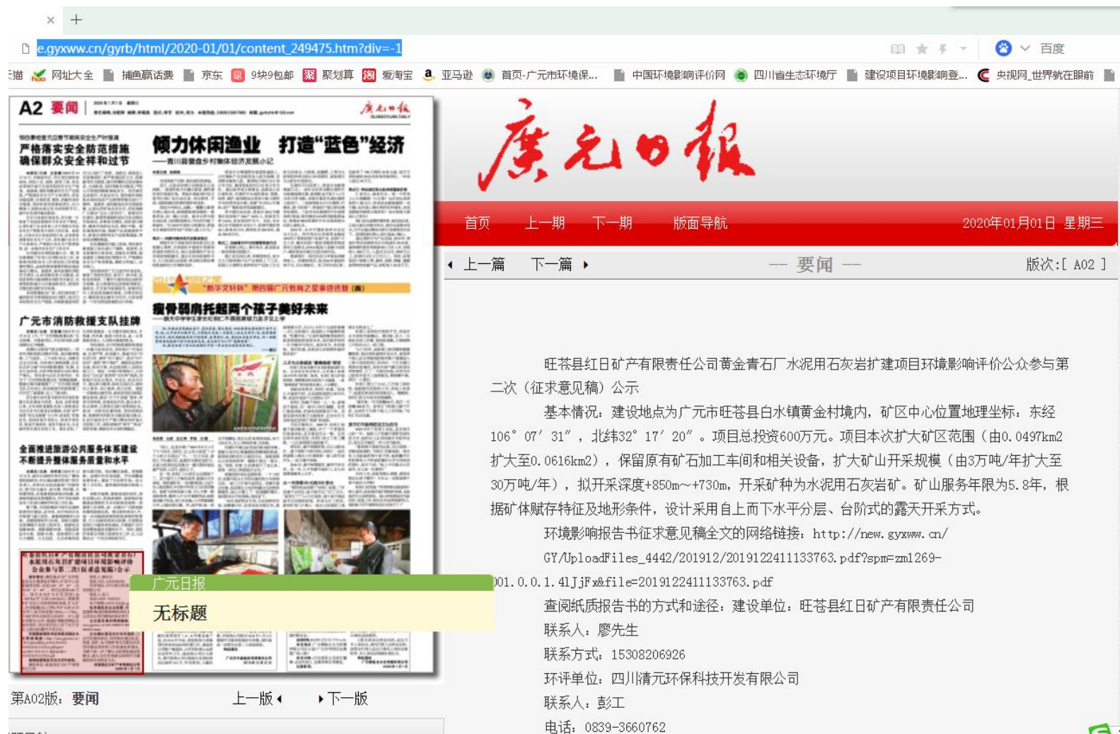
图4 广元日报（网上阅读版）公参公示截图（ http://e.gyxww.cn/gyrb/html/2020-01/01/content_249475.htm?div=-1 ）