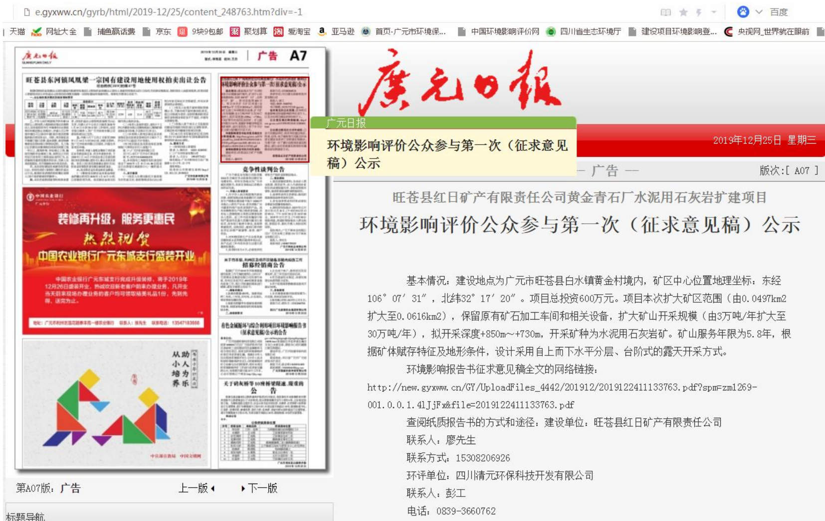
图3 广元日报（网上阅读版）公参公示截图（ http://e.gyxww.cn/gyrb/html/2019-12/25/content_248763.htm?div=-1 ）