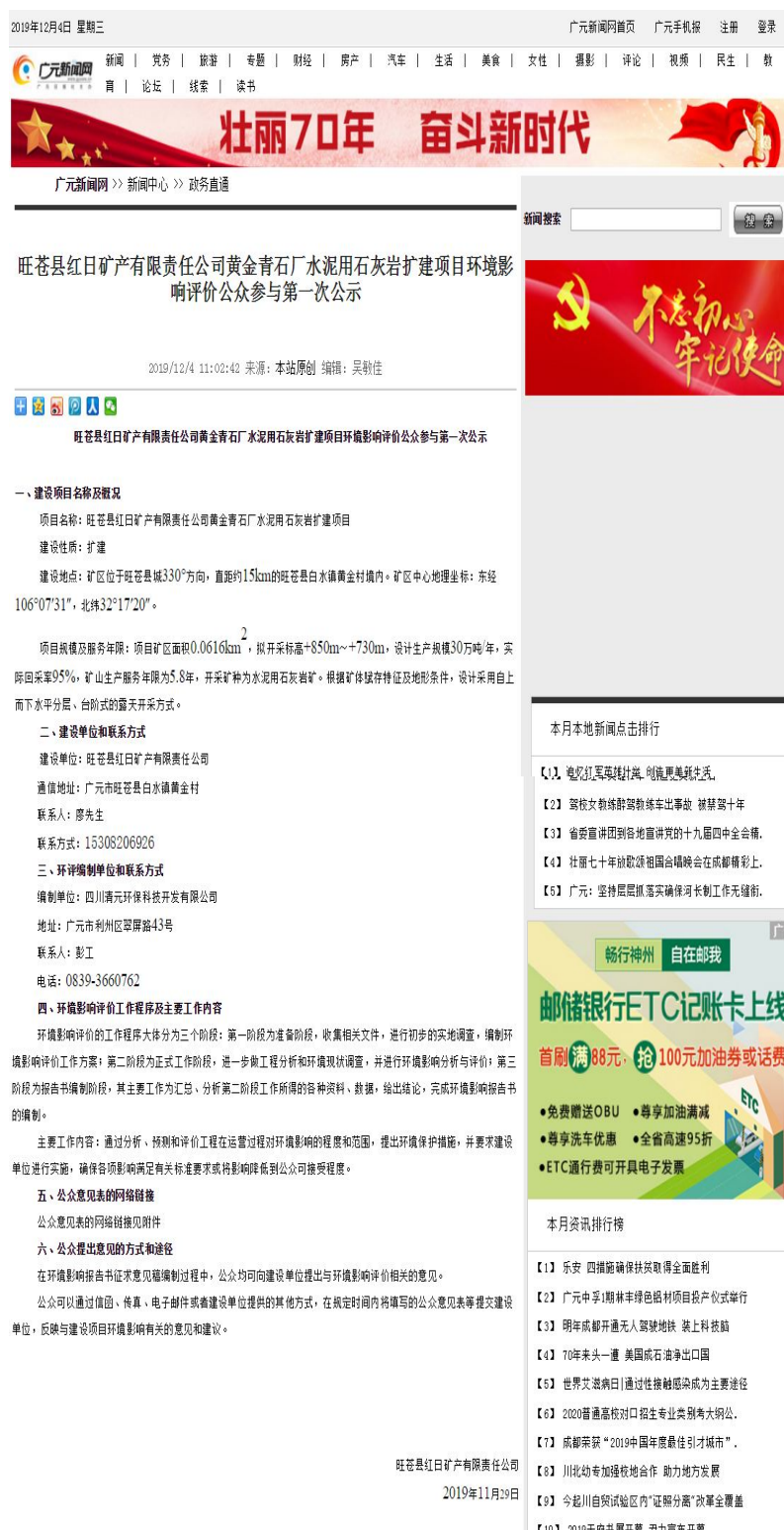
图1 第一次网络公示截图

等。公示时间为2019年12月4日，符合《建设项目环境影响评价公众参与暂行管理办法》（环发2006[28]号）第十条规定。