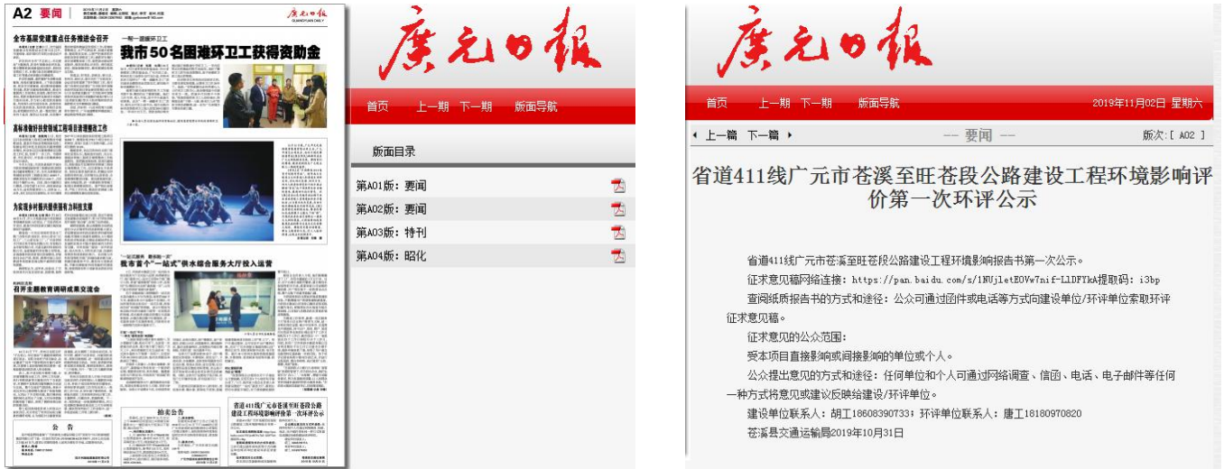
图3.2-2 报刊第一次公示