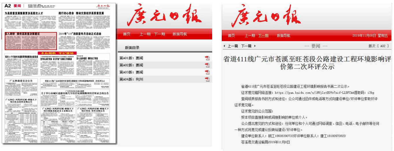
图3.2-3 报刊第二次公示