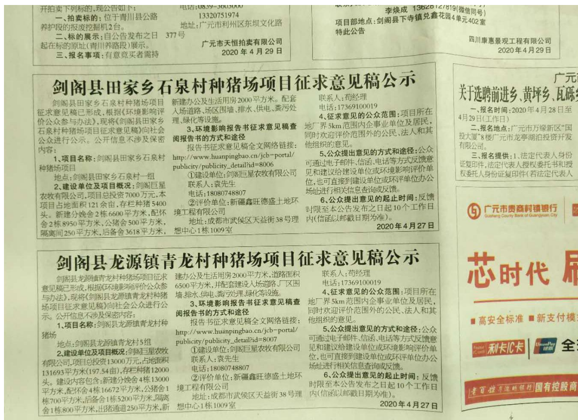
2020年4月29日在广元日报公示照片

三、建设单位于2020年4月26日---2020年5月9日（10个工作日）在石泉村村委进行了张贴公示。