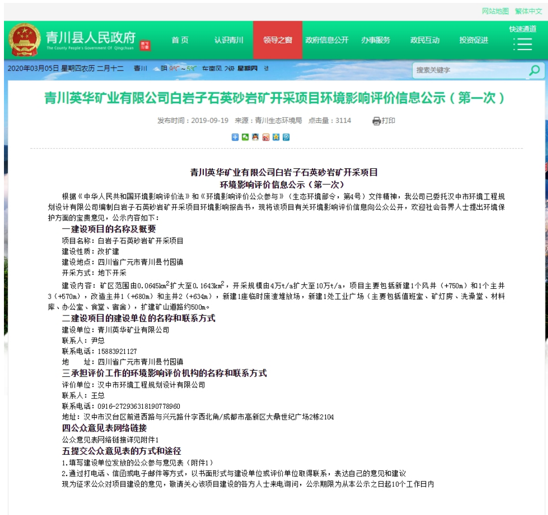
图 2-1 环境影响评价第一次公示网络公开截图