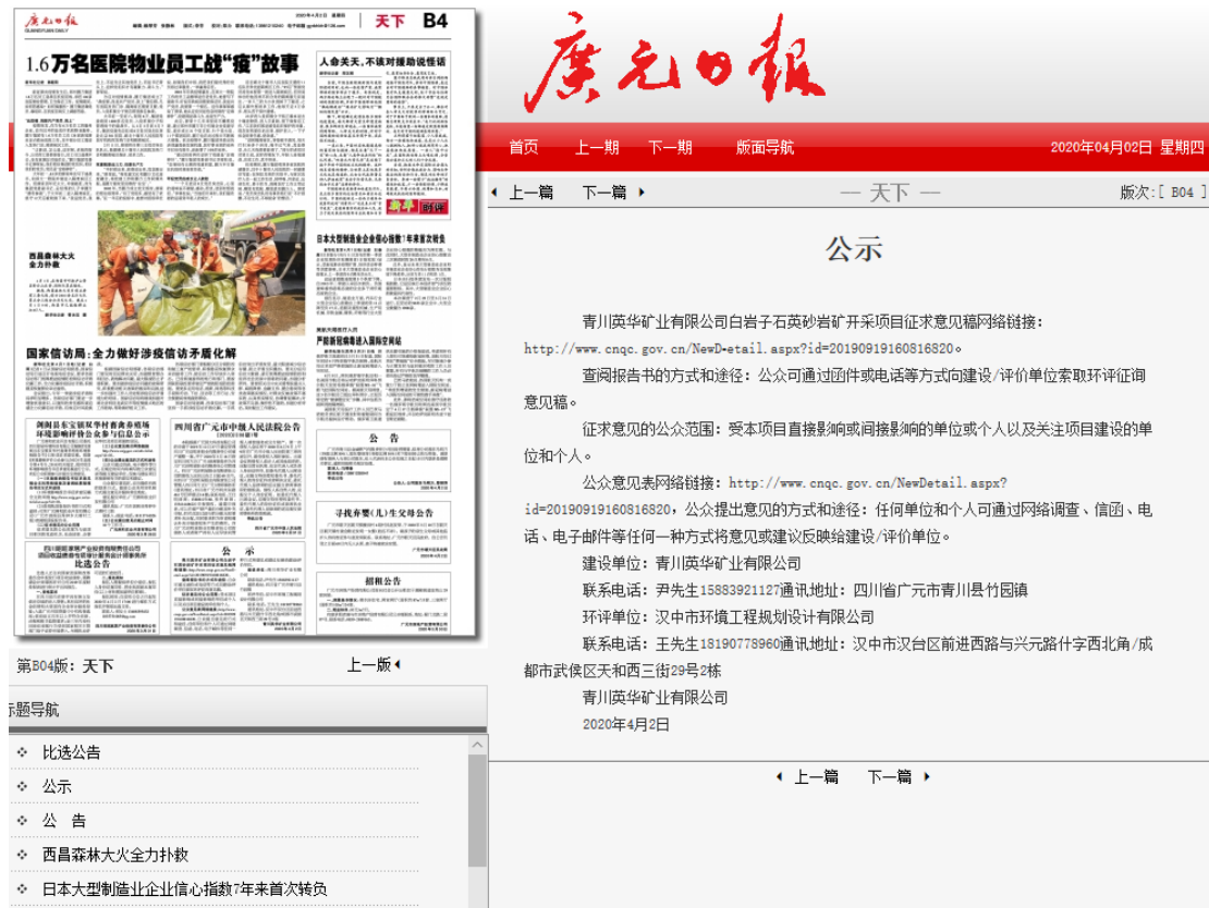
图 3-2 环境影响评价第一次公示登报公开截图

根据《环境影响评价公众参与办法》（生态环境部令第4号）要求，本项目于2020.4.2将公示信息刊登在广元日报，公示内容如下。