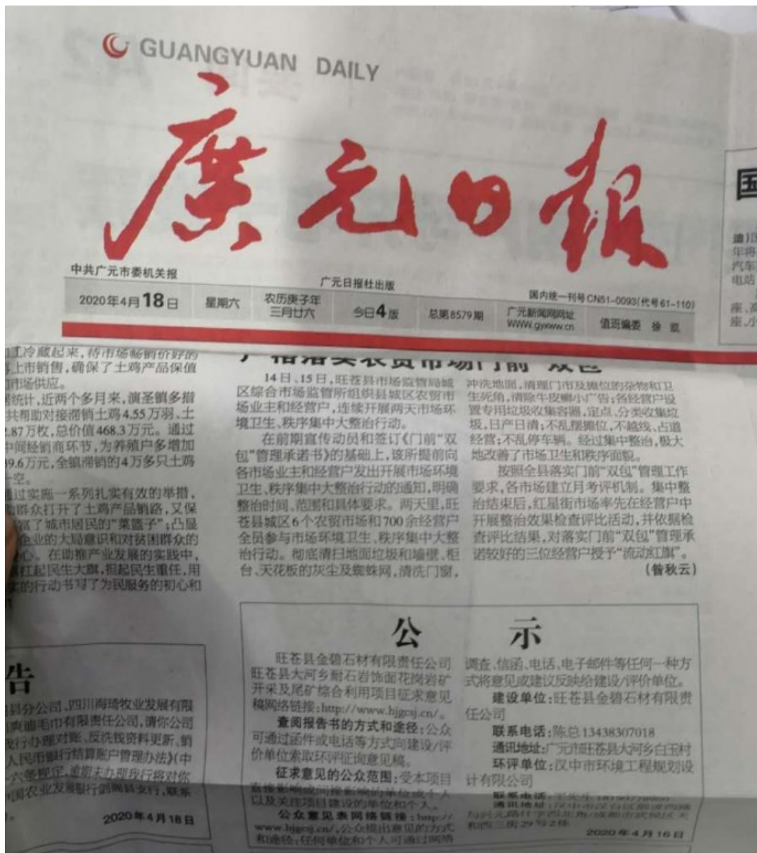
图 3-2 环境影响评价第一次公示登报公开截图