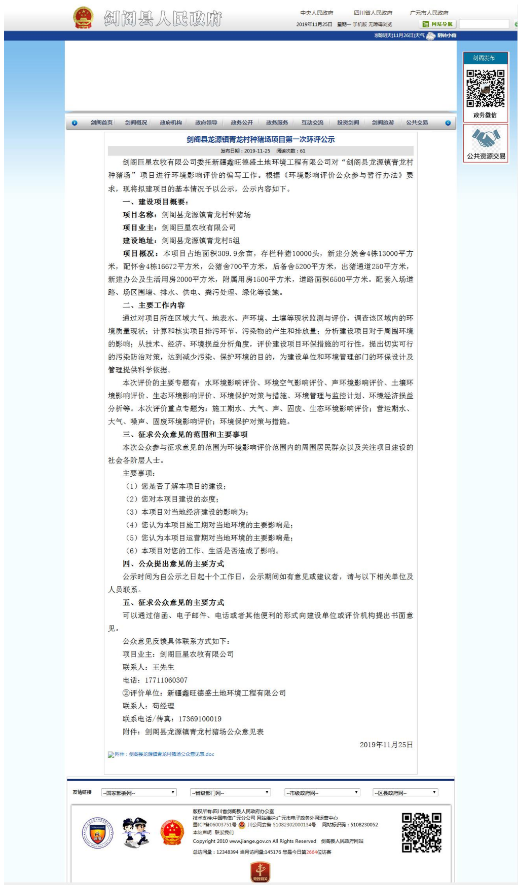
第一次网上公示截图