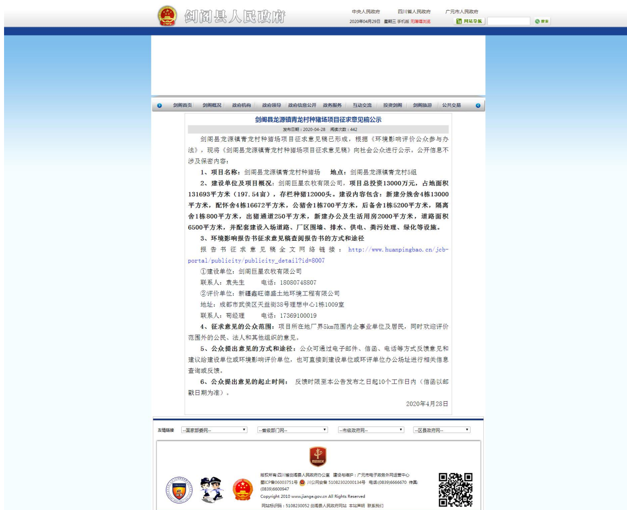
剑阁县人民政府网上公示截图