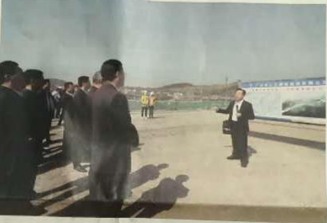
广元市一季度经济形势分析会暨项目投资“大比武”现场推进会现场。市领导正在听取汇报。