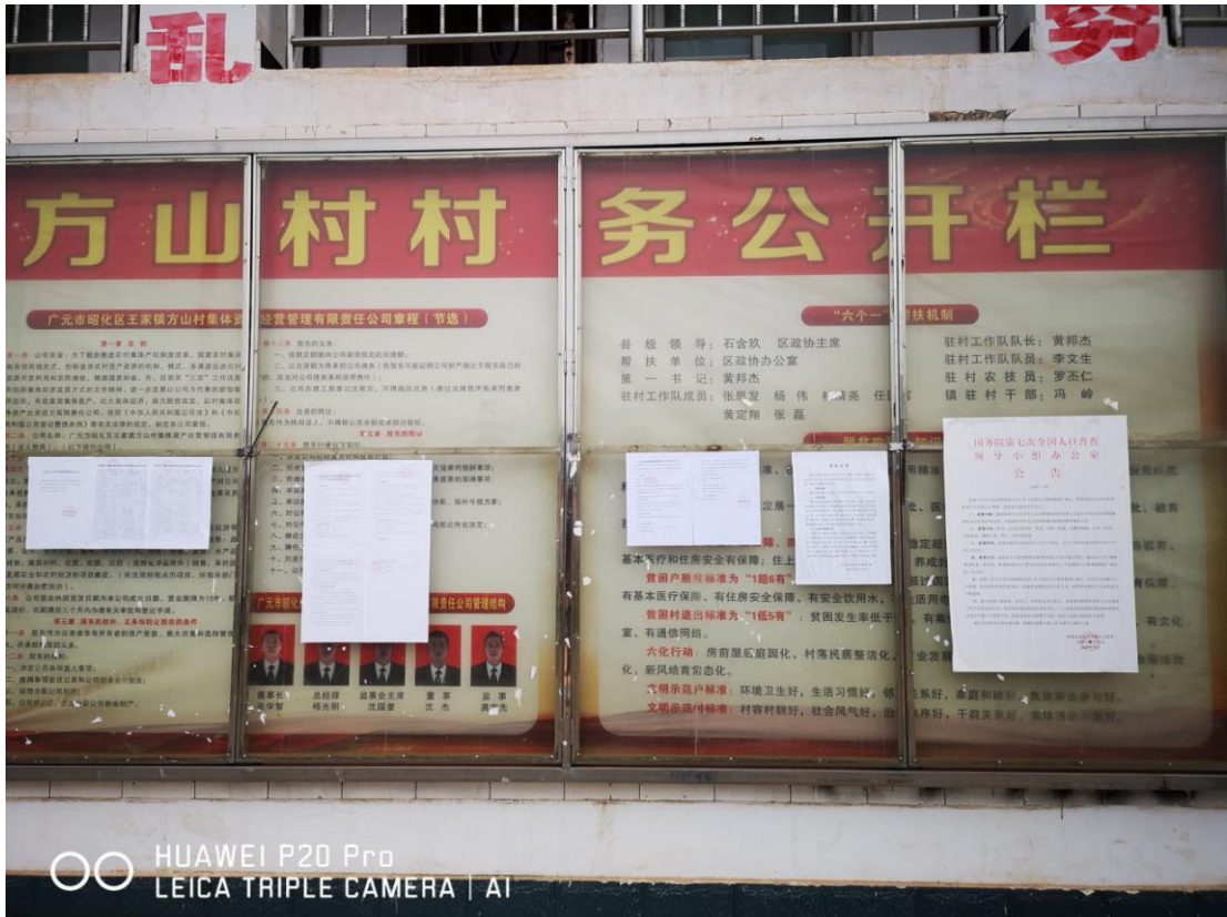
HUAWEI P20 Pro LEICA TRIPLE CAMERA | AI