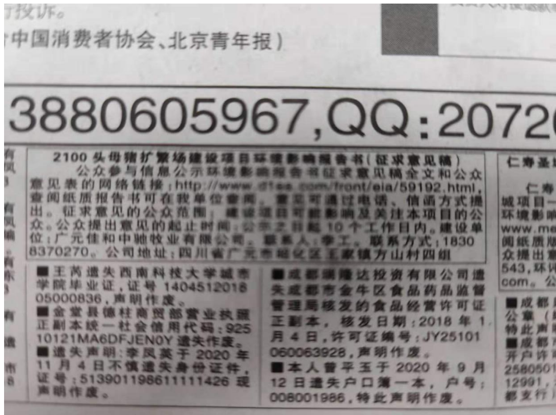
图 3-2 项目首次登报照片