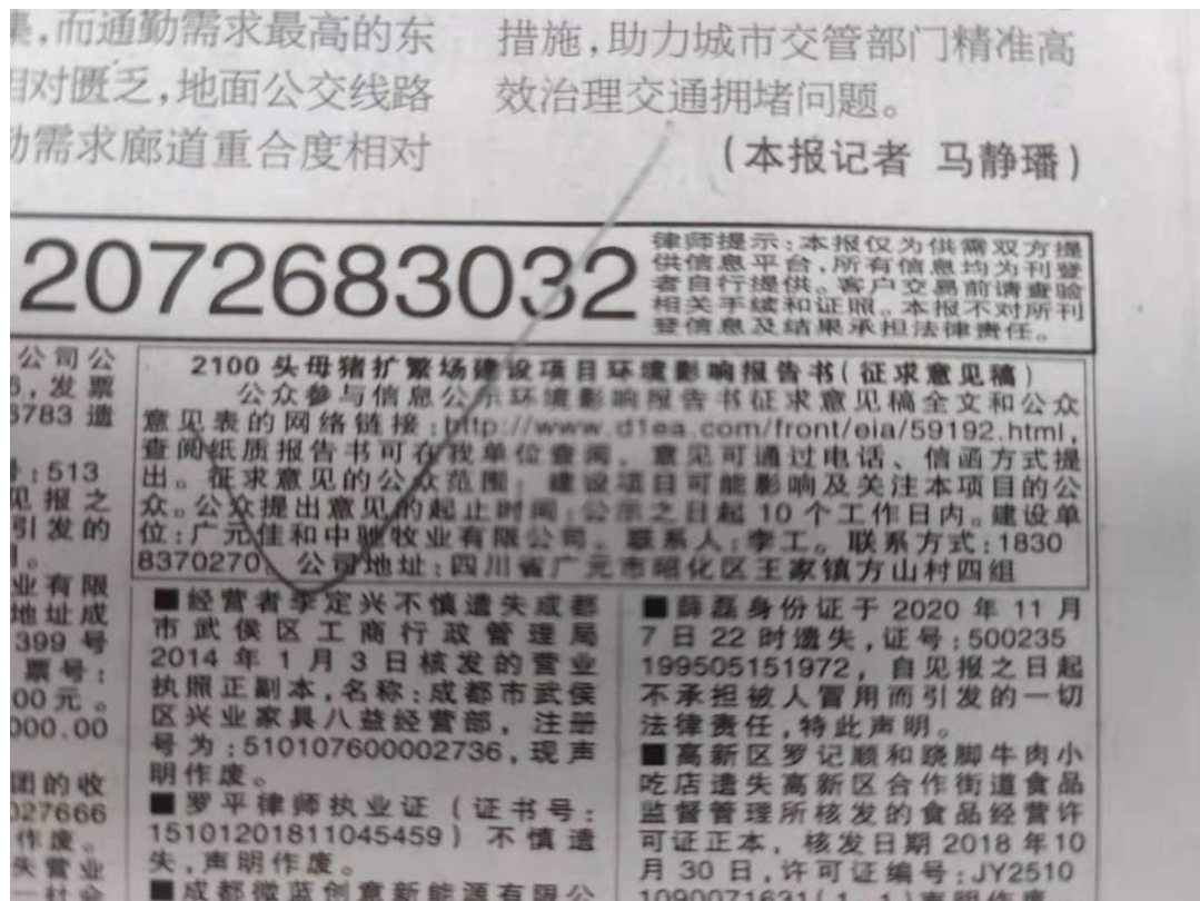
图 3-3 项目第二次登报照片