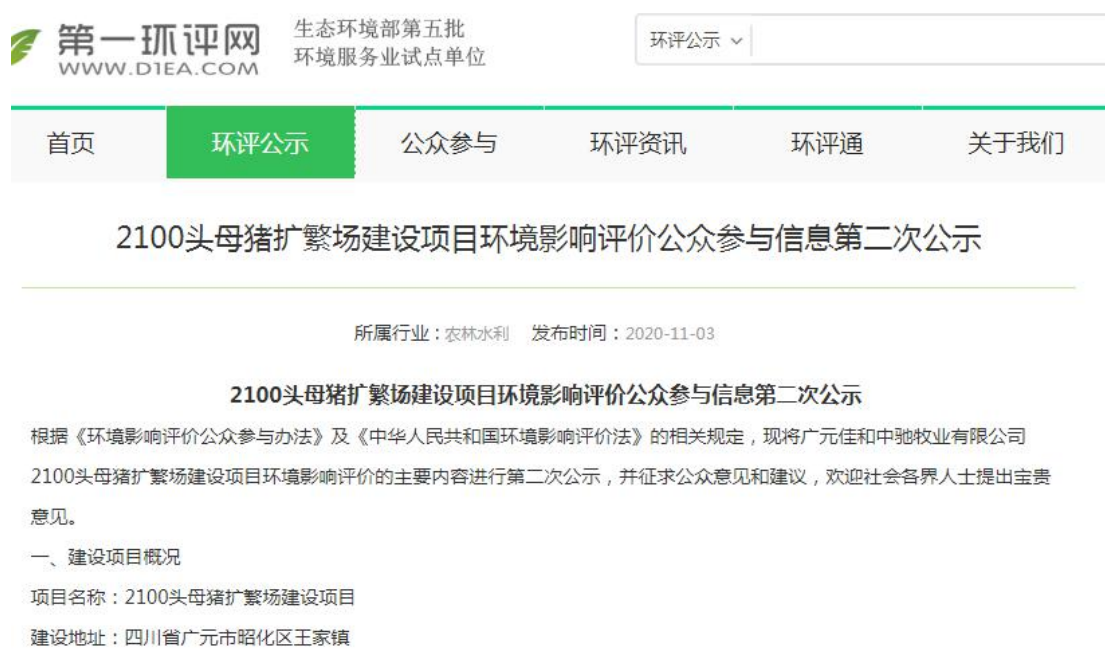
图 3-1 项目环境影响报告书征求意见稿信息公示截图

项目环境影响评价信息公开载体选择第一环评网，网络公示时间为 2020 年 11 月 3 日、网址为： http://www.d1ea.com/front/eia/59192.html ，截图如图 3-1。