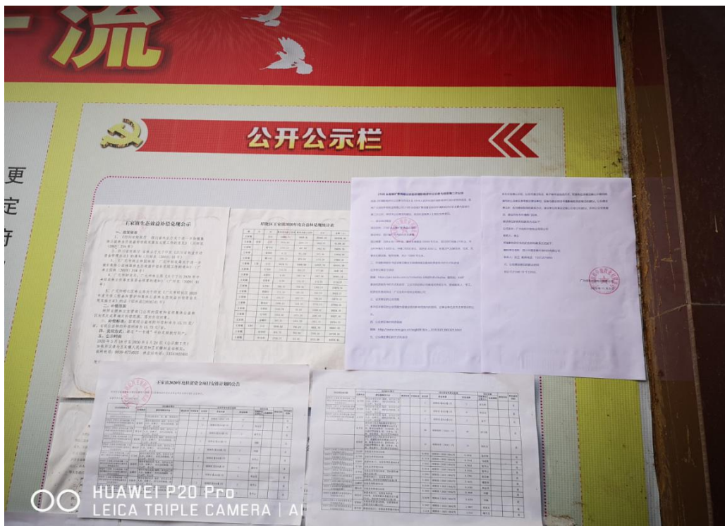
王家镇政府公开张贴栏