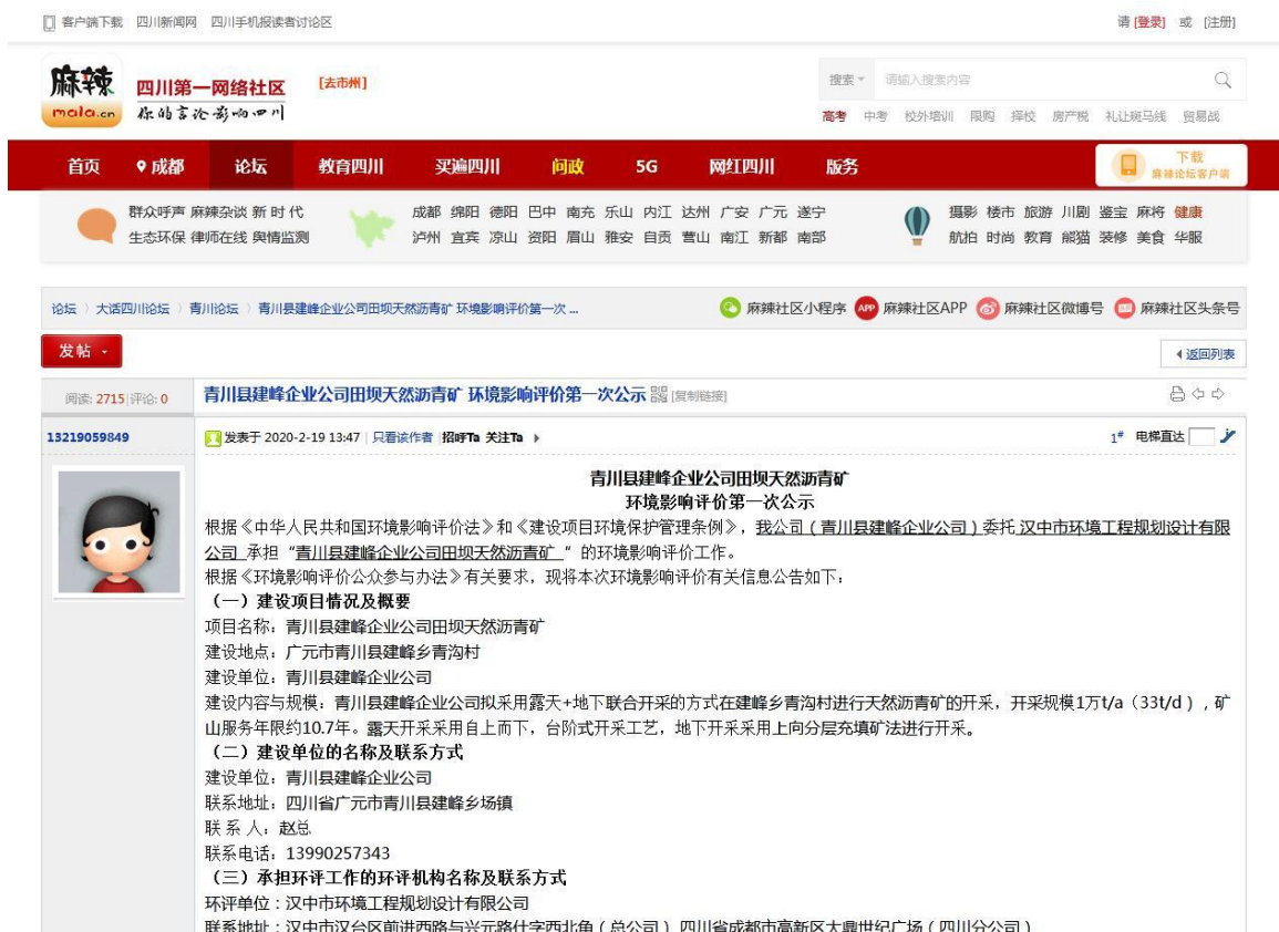
图 2-1 环境影响评价第一次公示网络公开截图

本项目于2020年2月19日在四川麻辣社区广元青川网站对《青川县建峰企业公司田坝天然沥青矿项目环境影响评价第一次公示》，链接： https://www.mala.cn/thread-15860272-1-1.html ，公开内容如下：