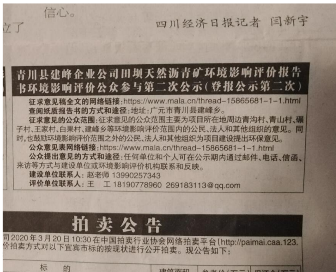
图 3-3 环境影响评价第二次公示登报公开截图