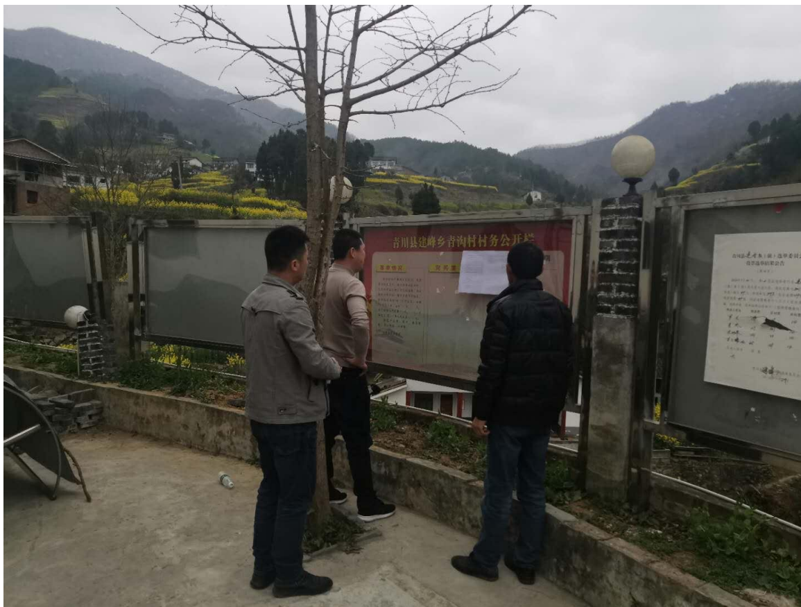
图 3-4 环境影响评价张贴公示照片