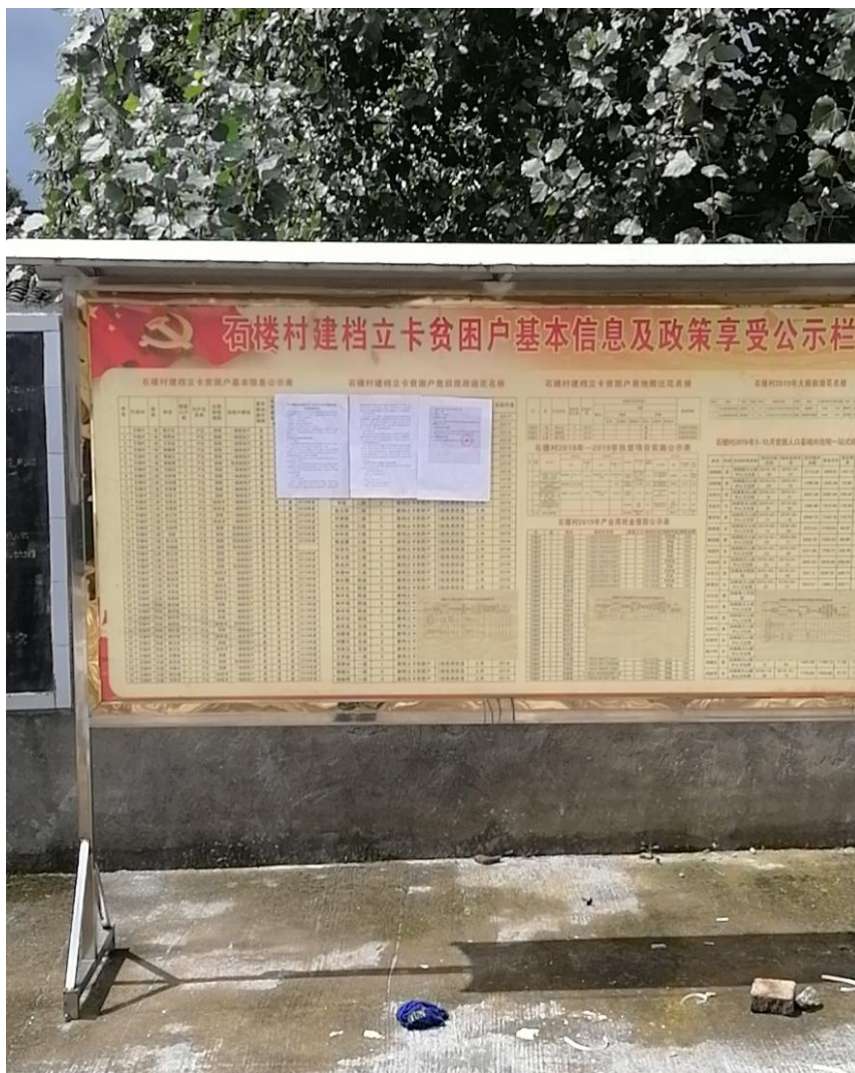
村公示栏现场照片