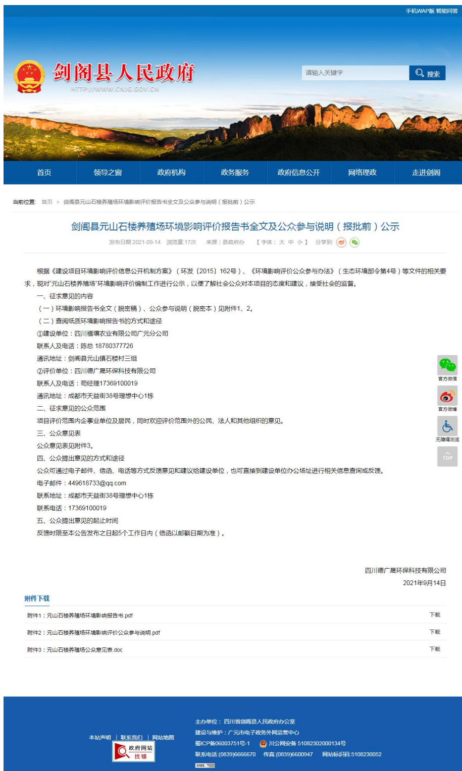
项目环境影响报告书报批前公示截图