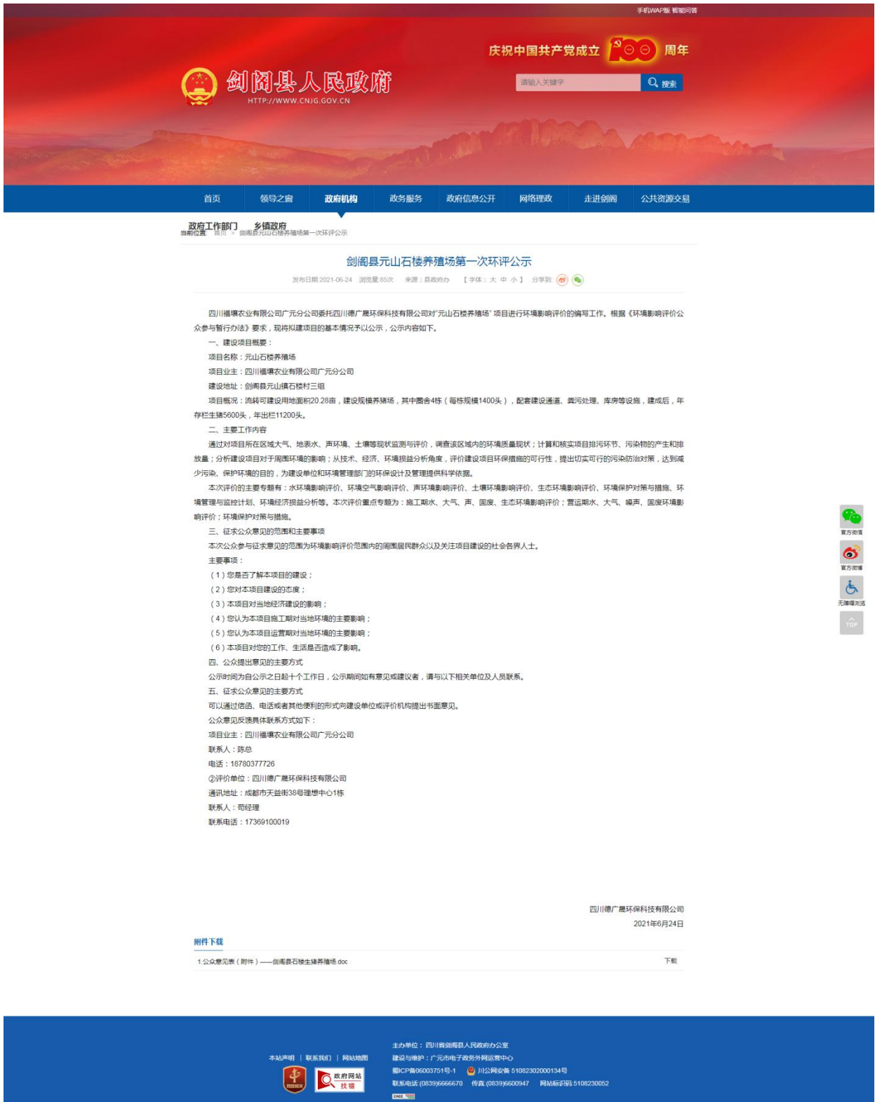
第一次网上公示截图