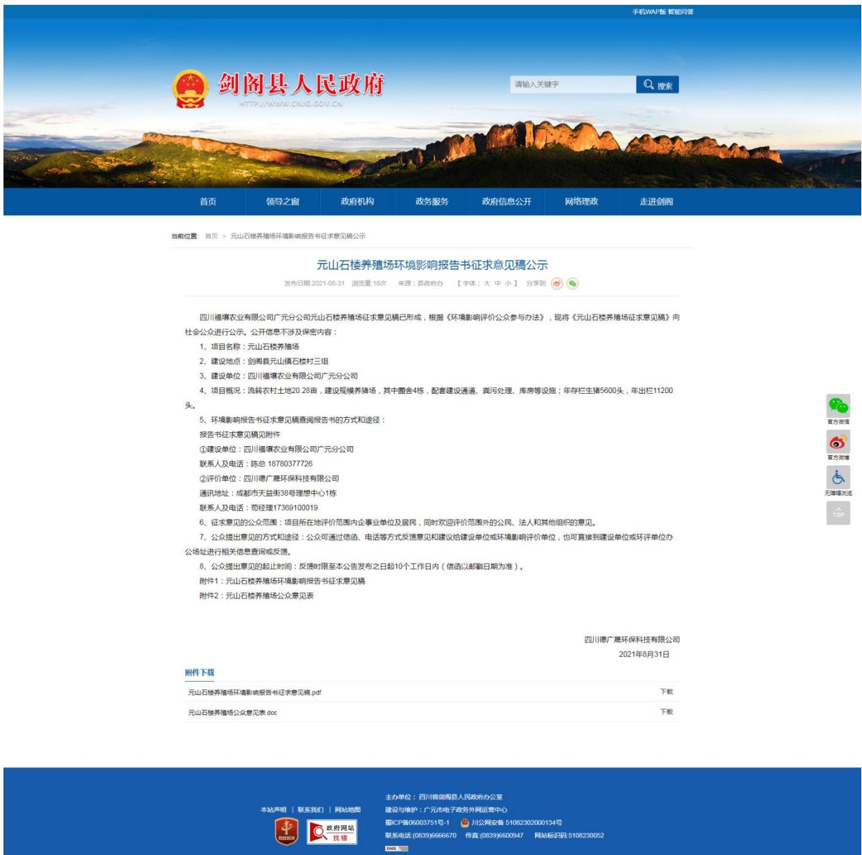
剑阁县人民政府网网上公示截图

建设单位于2021年8月31日在剑阁县人民政府网、2021年8月24日环评宝对项目环境影响报告书征求意见稿进行了网上公示，（ http://www.cnjg.gov.cn/new/detail/20210831112038994.html 、 http://www.huanpingbao.cn/jcb-portal/publicity/publicity_detail?id=18294 ），公示时间为2021年8月31日---2021年9月13日（共计10个工作日）。