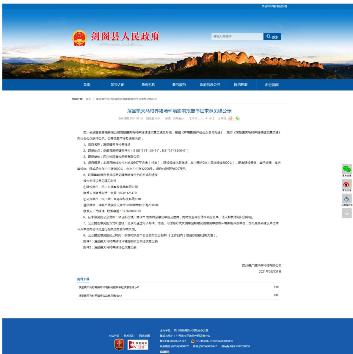
剑阁县人民政府网网上公示截图

建设单位于2021年8月31日在剑阁县人民政府网对项目环境影响报告书征求意见稿进行了网上公示，公示时间为2021年8月31日---2021年9月13日（共计10个工作日）。