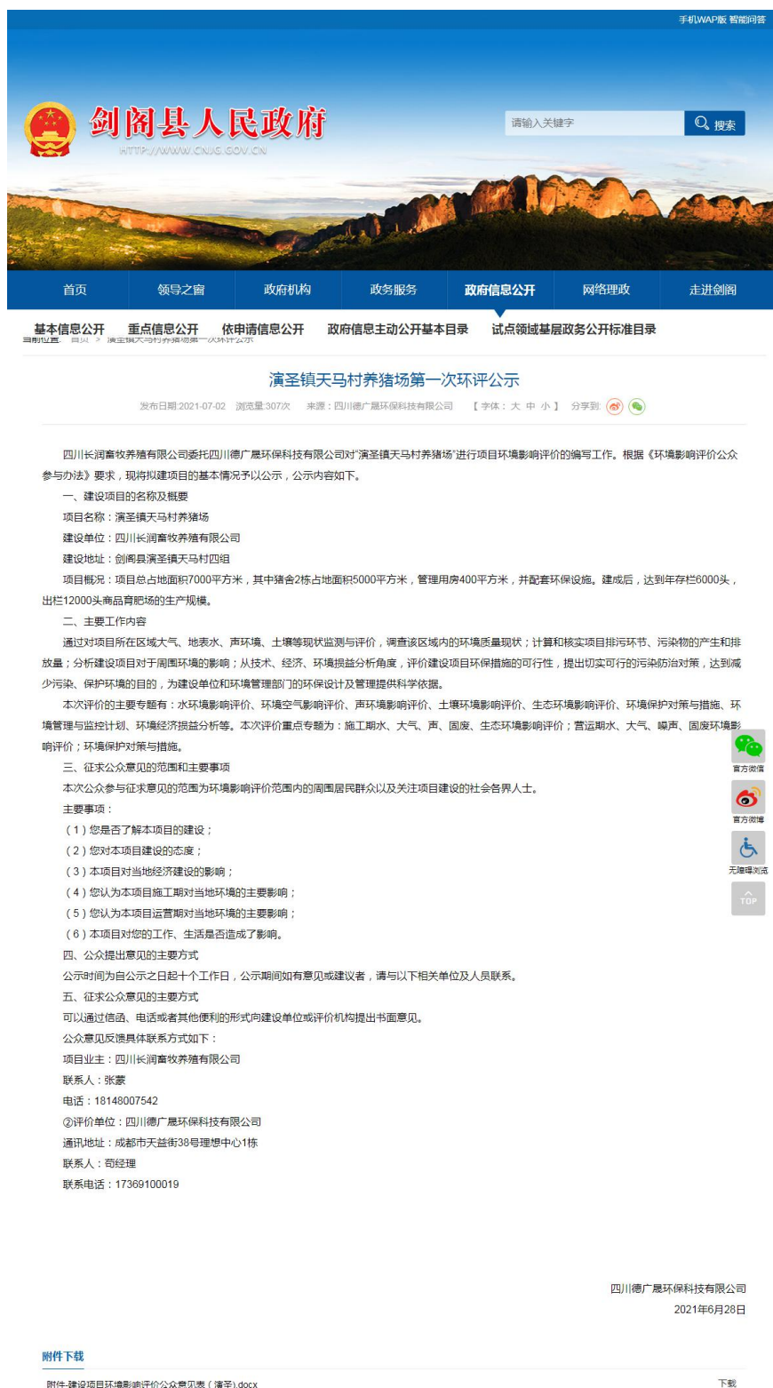
第一次网上公示截图