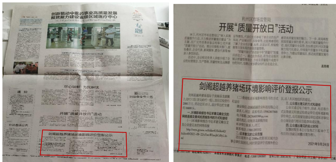
图 3-2 第一次报纸公示截图

根据《环境影响评价公众参与办法》(生态环境部令第4号)，项目于环境影响报告书征求意见稿公示期间分别于2021年9月25日、28日在广元日报进行了两次登报公示，公示内容详见图3-2及图3-3；