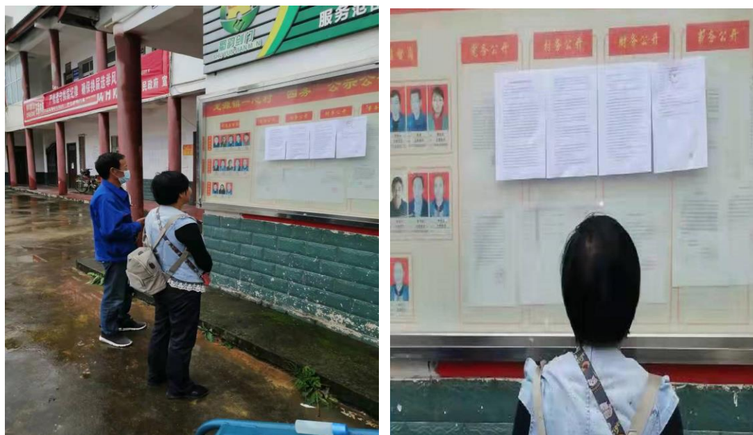
图 3-4 现场张贴公示（一）