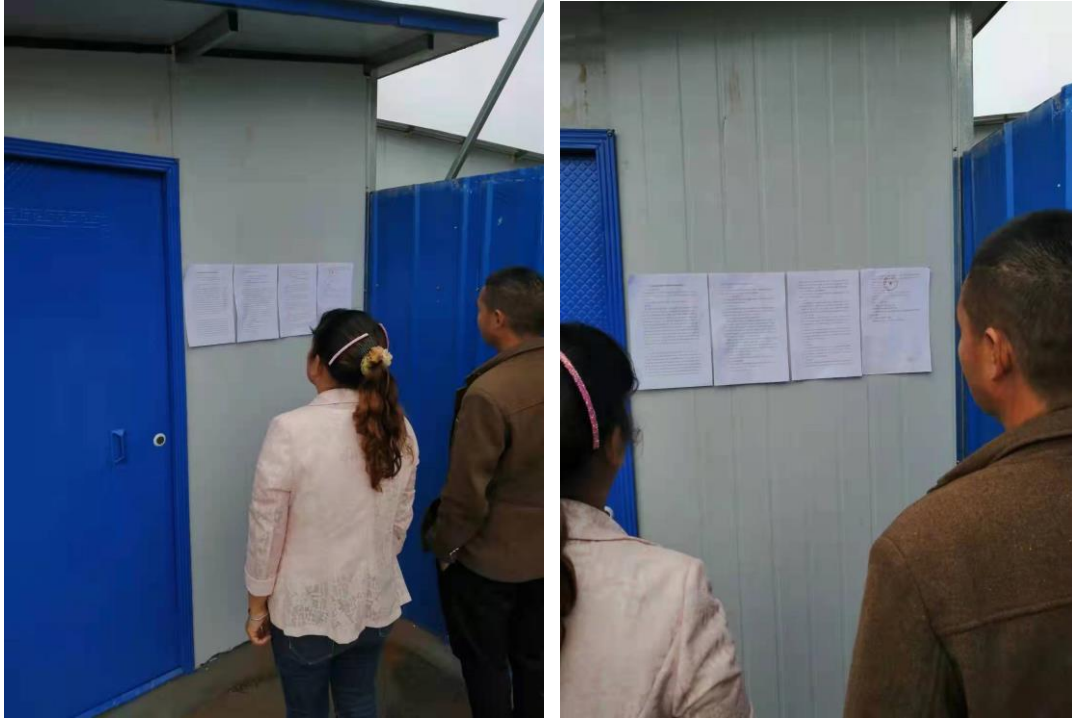
图 3-5 现场张贴公示（二）

项目张贴公示时间为 2021 年 9 月 22 日~10 月 9 日，公示时间为 10 个工作日；项目张贴公示照片见图 3-4、图 3-5。