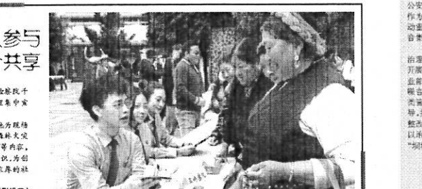
旺苍县九义镇开展市域治理人人参与、和谐社会个个共享活动。

近日,旺苍县九义镇开展市域治理人人参与、和谐社会个个共享活动,广泛发动群众参与社会治理,共建共治共享。