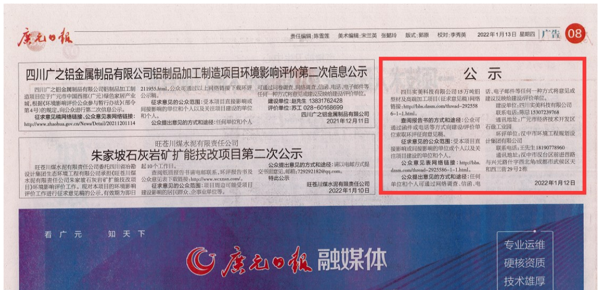
图 3-3 环境影响评价第二次公示登报公开截图

根据《环境影响评价公众参与办法》（生态环境部令第4号）要求，本项目于2022年1月13日将公示信息刊登在广元日报，公示内容如下。