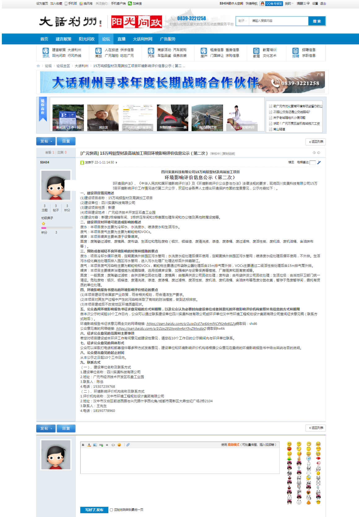
图 3-1 环境影响评价第二次公示网络公开截图