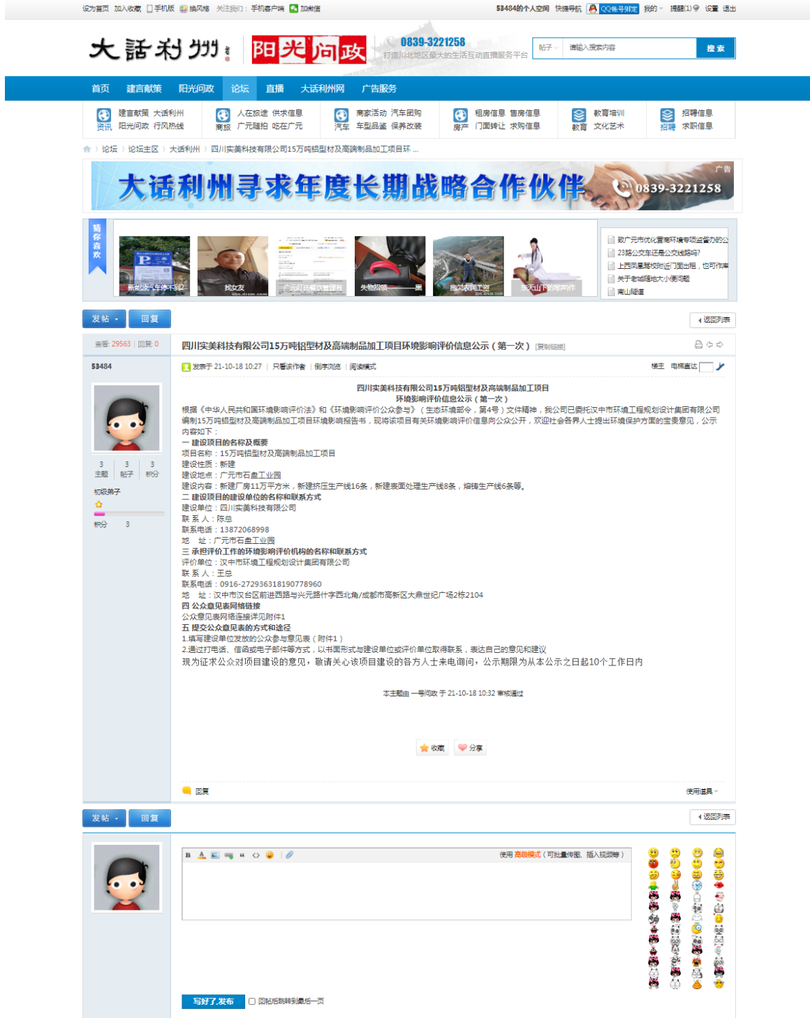
图 2-1 环境影响评价第一次公示网络公开截图