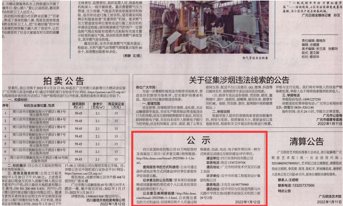
图 3-2 环境影响评价第一次公示登报公开截图

根据《环境影响评价公众参与办法》（生态环境部令第4号）要求，本项目于2021年1月12日将公示信息刊登在广元日报，公示内容如下。