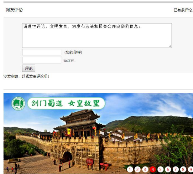
图 1.2-1 广元市新闻网网站第一次公示情况