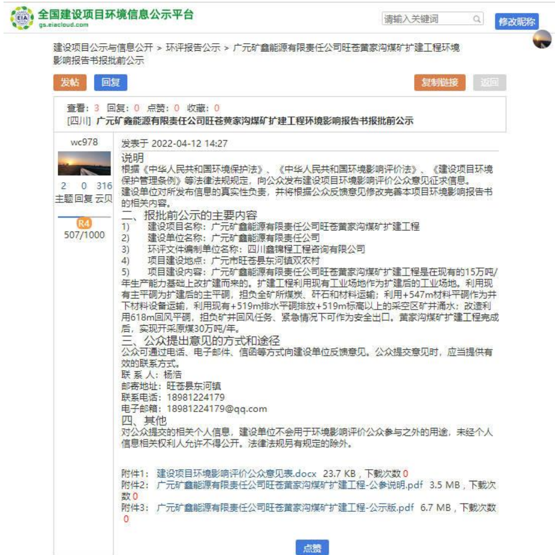
图 1.4-1 全国建设项目环境信息公示平台报批前公示情况

全国建设项目环境信息公示平台为全国性环境影响评价网络公示平台，故符合《办法》相关要求。