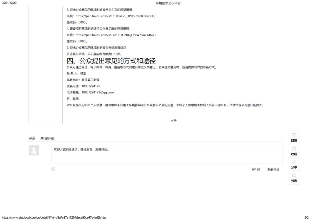
图 1.3-1 全国建设项目环境信息公示平台征求意见稿公示情况