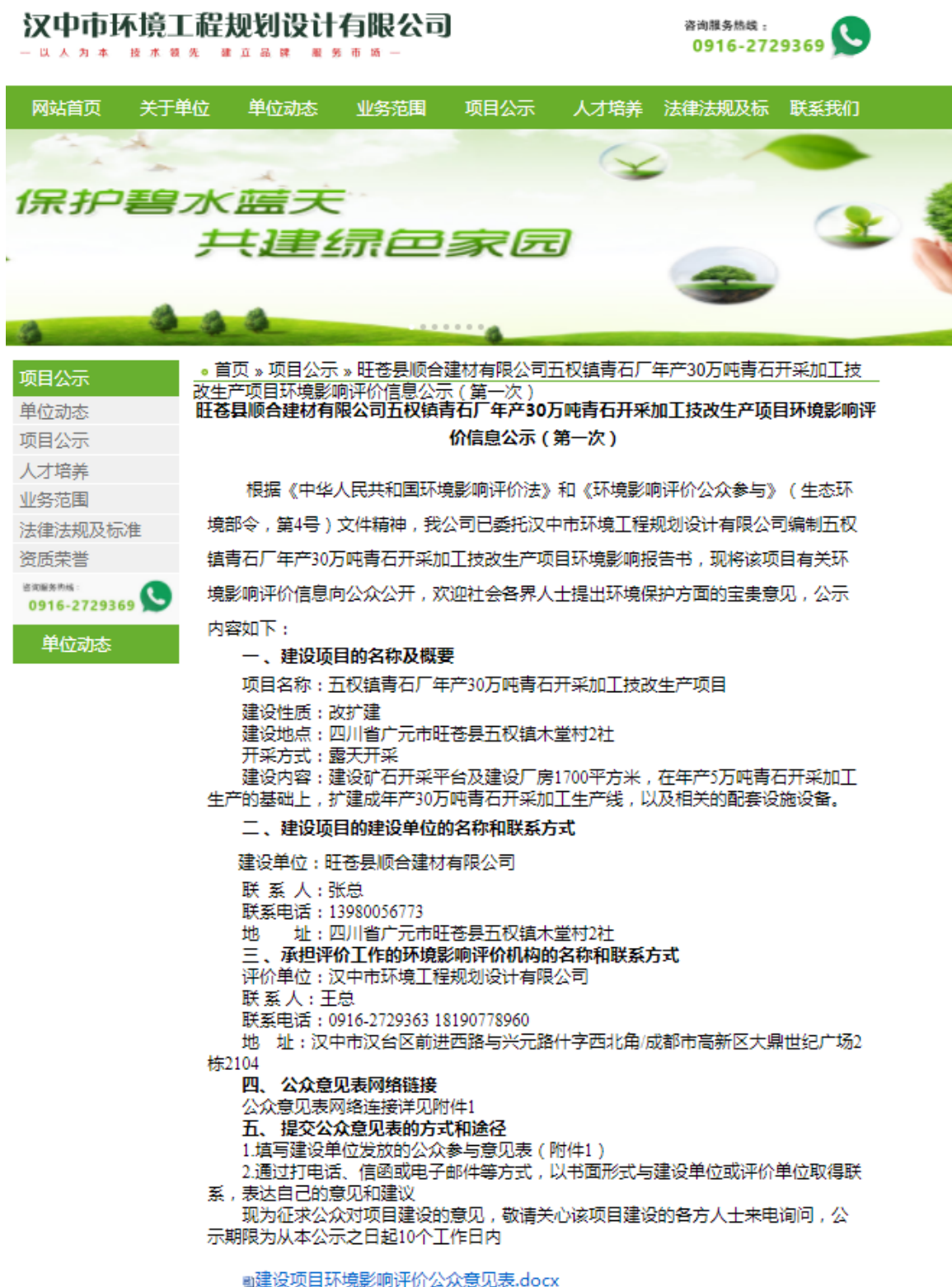
图 2-1 环境影响评价第一次公示网络公开截图