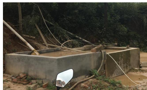
二级+三级沉淀池 ( 45\text{m}^3 )