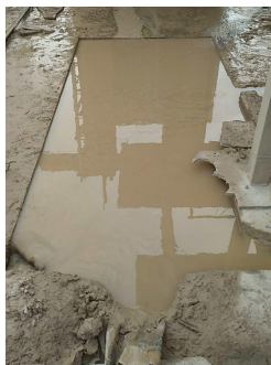
一级沉淀池 ( 3\text{m}^3 )

项目设置了3个沉淀池（总容积为 48\text{m}^3 ），本项目切割废水产生量为 2.25\text{m}^3/\text{d} ，因此沉淀池规模完全可以满足处理要求。