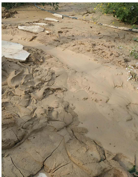
图 5-3 沉淀池底泥堆放区

针对沉淀池底泥，一级沉淀池每天进行清掏，二、三级沉淀池平均每两个月清掏一次，清掏后随意堆放在厂区（见图 5-3），环评要求设底泥晾晒池，将污泥干化后外售用于建材，底泥晾晒池应进行硬化、防风、加盖雨棚。结合项目平面布置及外环境关系，底泥干化暂存场地可设置于沉淀池南侧。