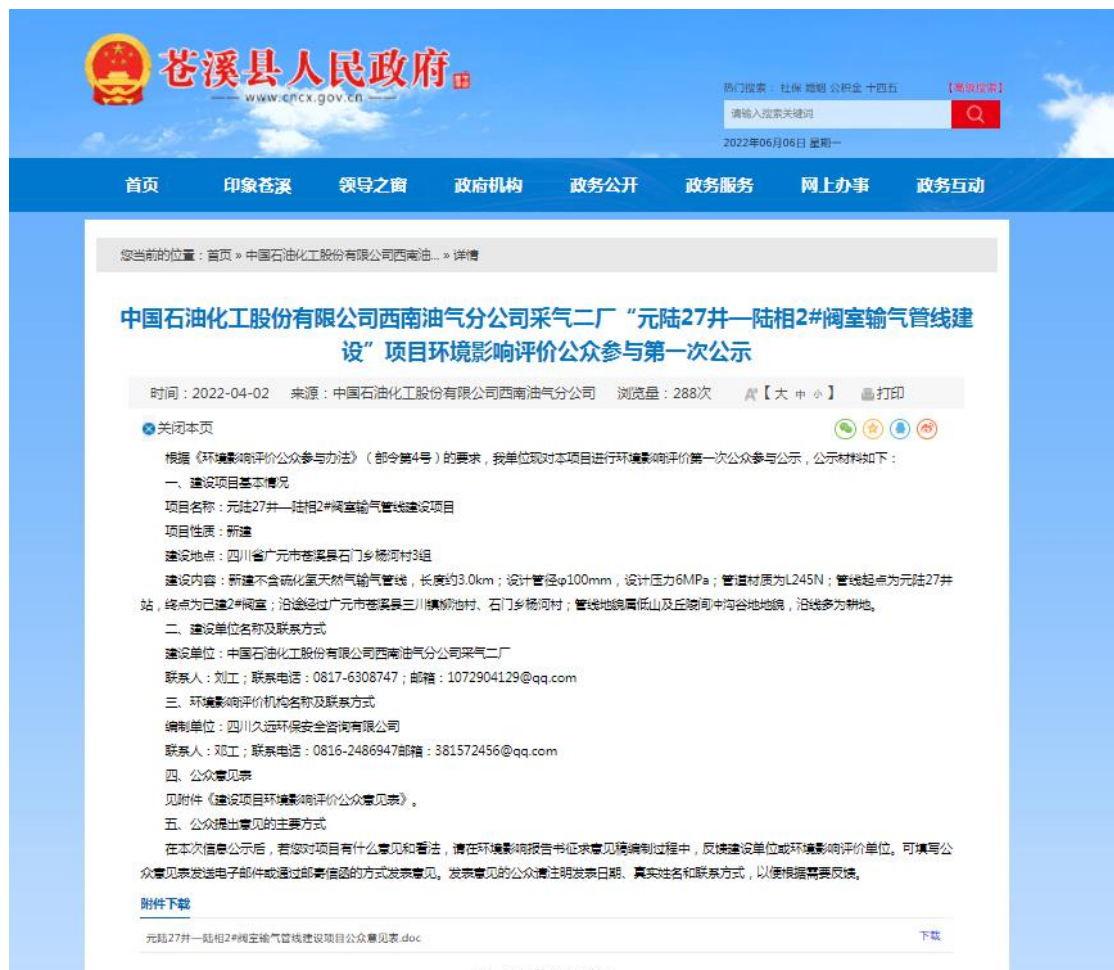
图 2 元陆 27 井—陆相 2# 阀室输气管线建设项目环境影响评价公众参与第一次公示

( http://www.cncx.gov.cn/news/show/20220402143043938.html )发布了第一次公众参与公告。公示截图如下：