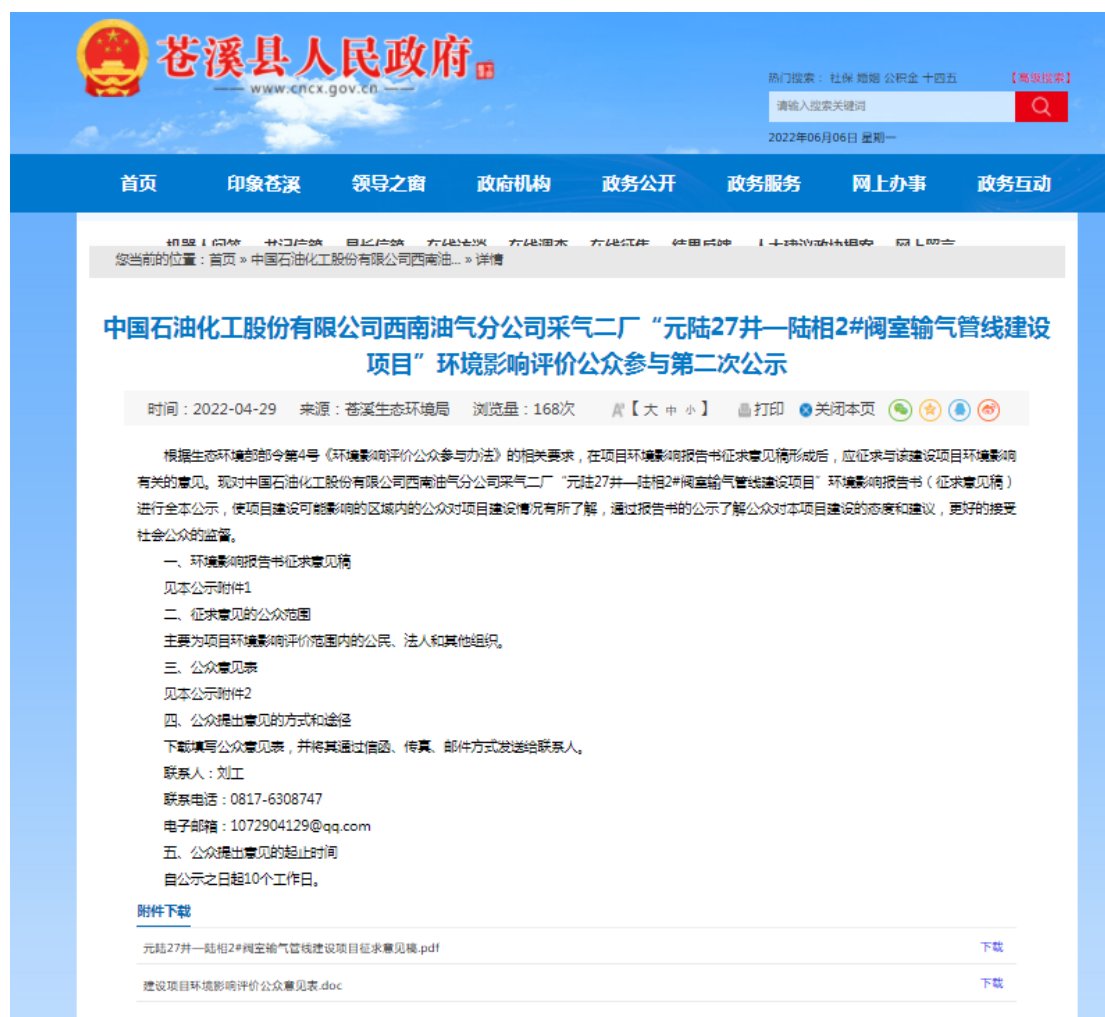
图 2 元陆 27 井—陆相 2#阀室输气管线建设项目环境影响评价公众参与第二次公示