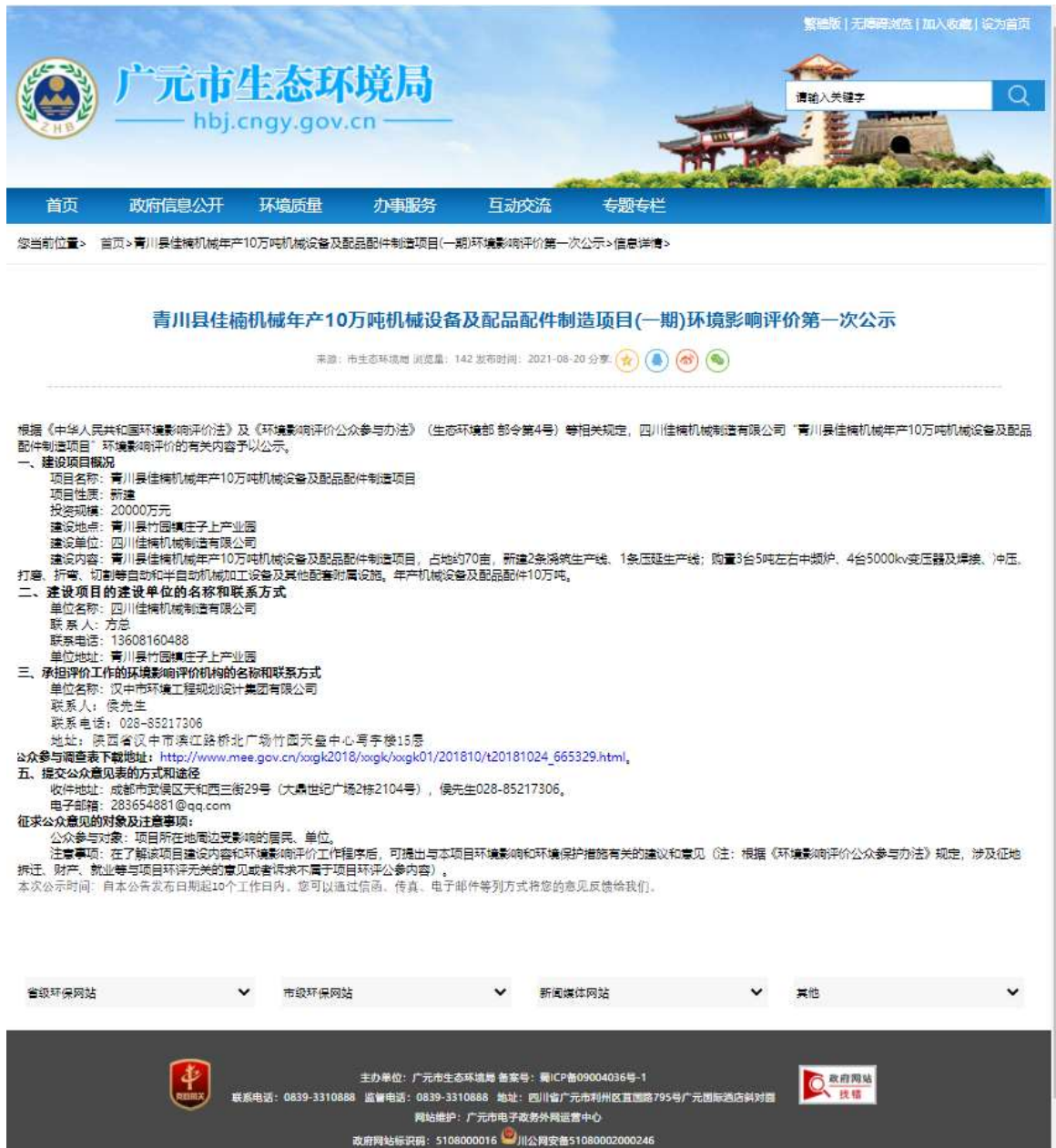
图 2-1 首次环境影响评价信息网络公开截图

对《青川县佳楠机械年产 10 万吨机械设备及配品配件制造项目(一期)环境影响评价第一次公示》进行了公开，公开内容如下。