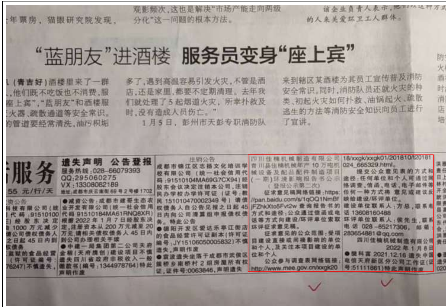
图 3-3 2022 年 1 月 7 日四川科技报上刊登内容