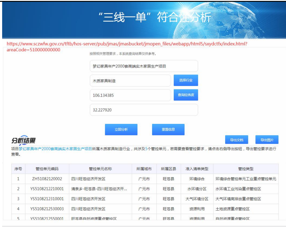
图1-4 本项目涉及的管控单元分析结果图

本项目位于广元市旺苍县环境综合管控单元工业重点管控单元（管控单元名称：四川旺苍经济开发区，管控单元编号：ZH51082120002）。