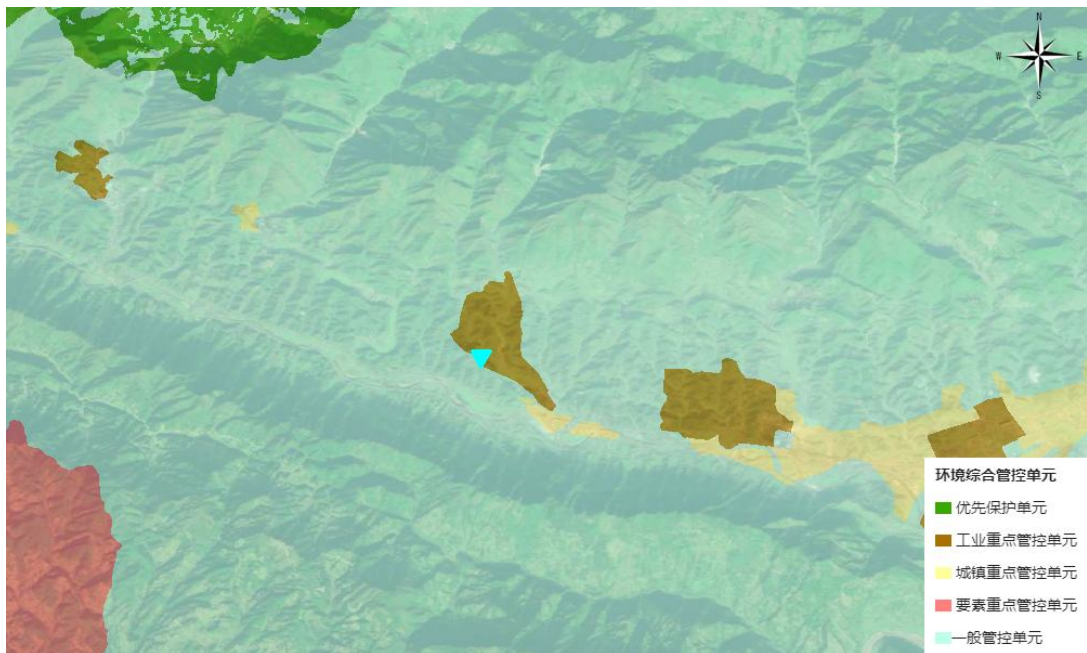
图1-5 项目与环境综合管控单元的位置关系图