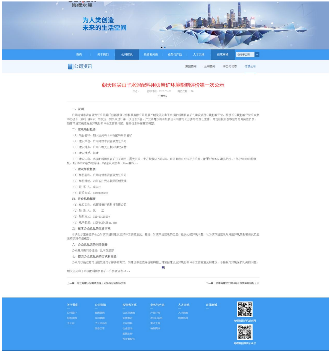
图 2-1 第一次环境影响评价信息公开网上截图