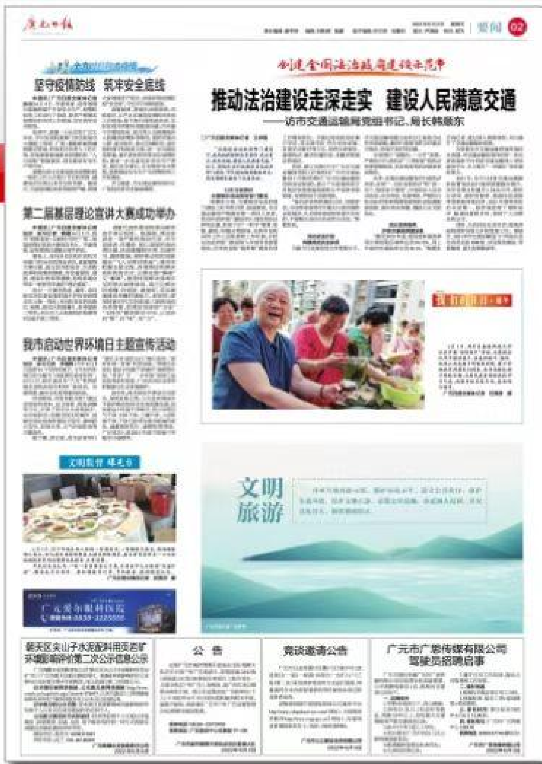
图 3-2 报纸公示截图