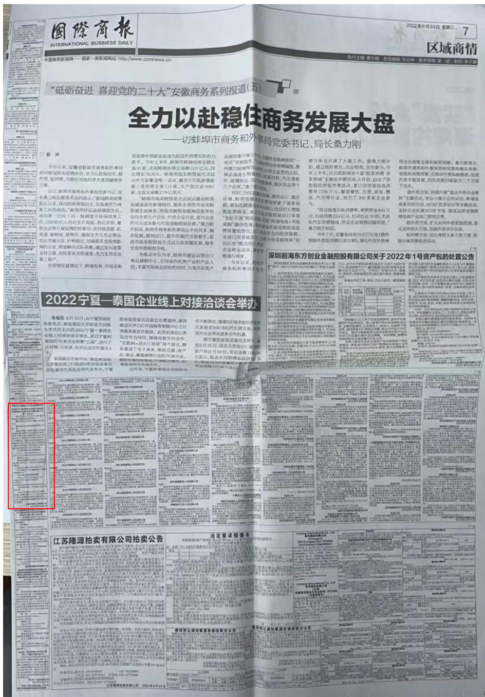
图3.2-2 报刊第一次公示