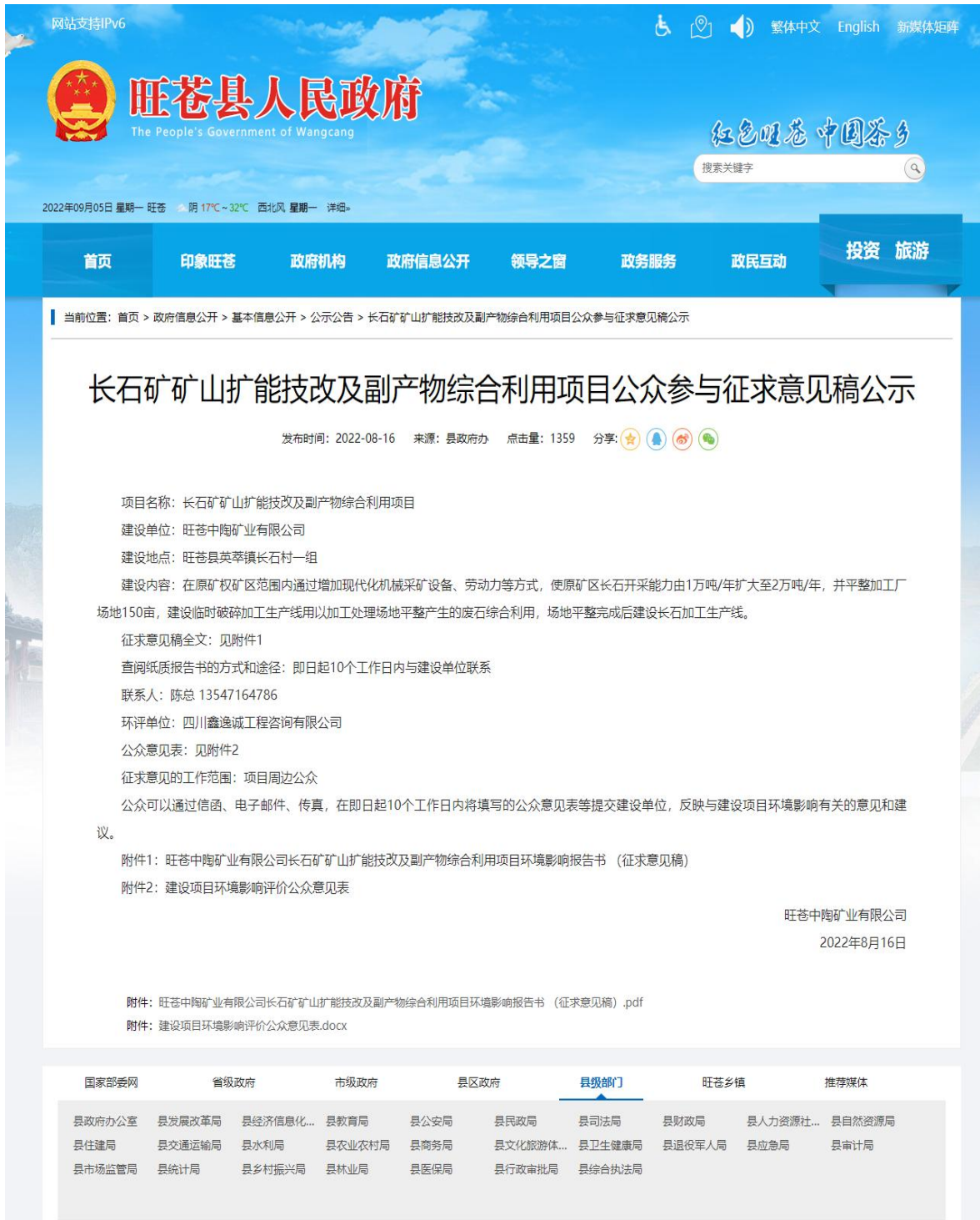
图3.2-1 项目环境影响评价公众公示截图