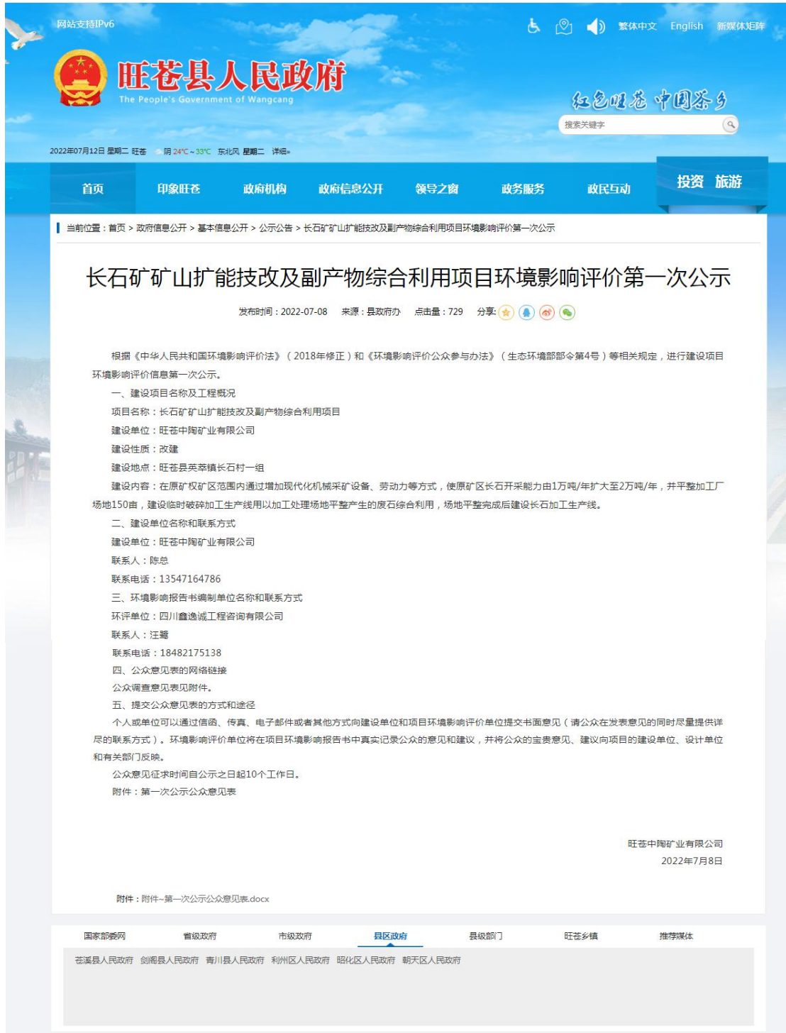
图2.2-1 项目环境影响评价第一次公示截图