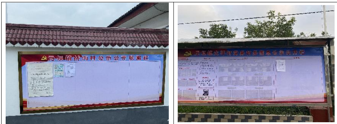
图4 现场张贴公示公告照片