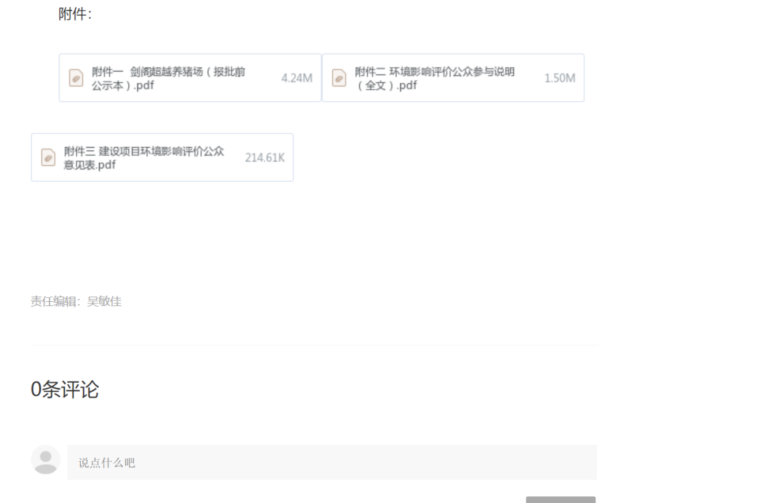
图 6-1 报批前网络公示截图