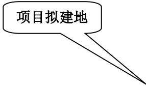
图 1-1 本项目与广元市家具产业城区位分布图

本项目选址位于中国西部(广元)绿色家居产业城旺苍尚武片区，符合空间结构与功能布局。综上所述，本项目符合广元市家具产业发展规划。