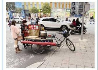
2月16日，笔者在南海河沿路巡查时看到，有流动摊贩在路口摆摊占道行人道和盲道，还有市民将车停在未设置停车位的地方。