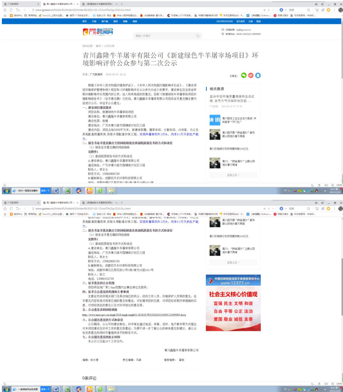
图2 第二次网络公示截图