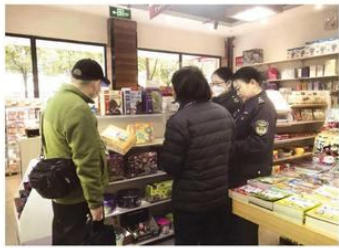
检查儿童和学生用品

市场监管部门在持续开展“春蕾行动2023”专项行动中,严厉打击各类违法行为,把准尺度,把握分寸,积极探索柔性执法和包容审慎监管的监管理念,推动行政执法由“严罚式”向“容错式”转变。