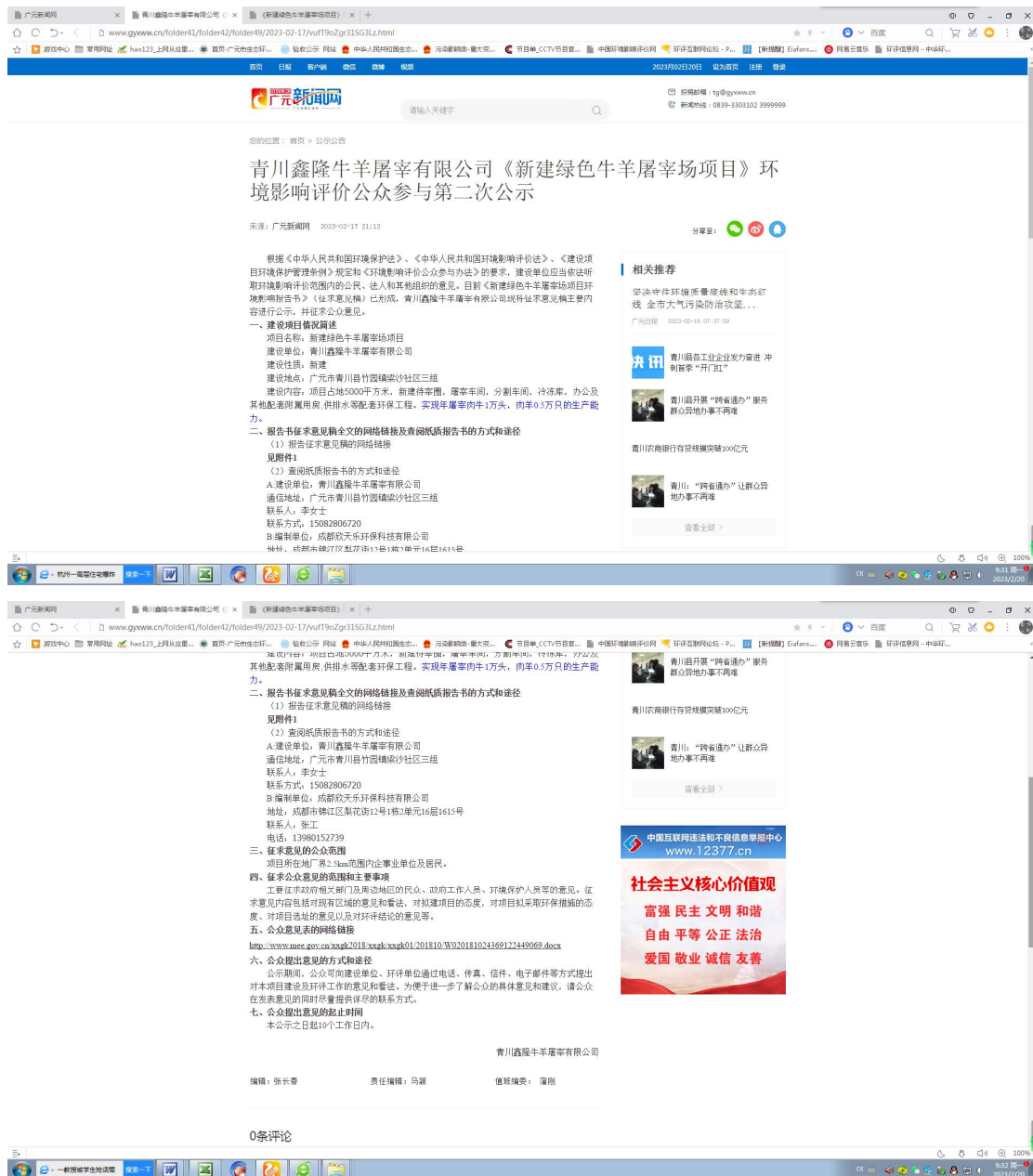
图2 第二次网络公示截图