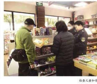
检查儿童和学生用品

下一步,市市场监管局将结合“春雷行动2023”,继续注重包容审慎执法的“时、度、效”,强化柔性执法和包容审慎监管,持续优化营商环境,不断激发市场活力和创造力。