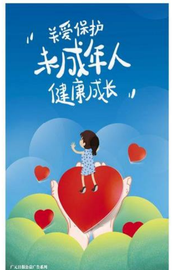
关爱保护 未成年人 健康成长

本报讯(记者 李华)近日,方大集团达州钢铁广元领航公司顺利完成烧结系统环冷走轮改造,标志着该厂在提升生产效率和降低能耗方面取得了重要突破。 达州钢铁广元领航公司相关负责人表示,该厂将持续加大技术改造力度,不断提升生产效率和降低能耗,为广元市的钢铁产业发展做出更大贡献。