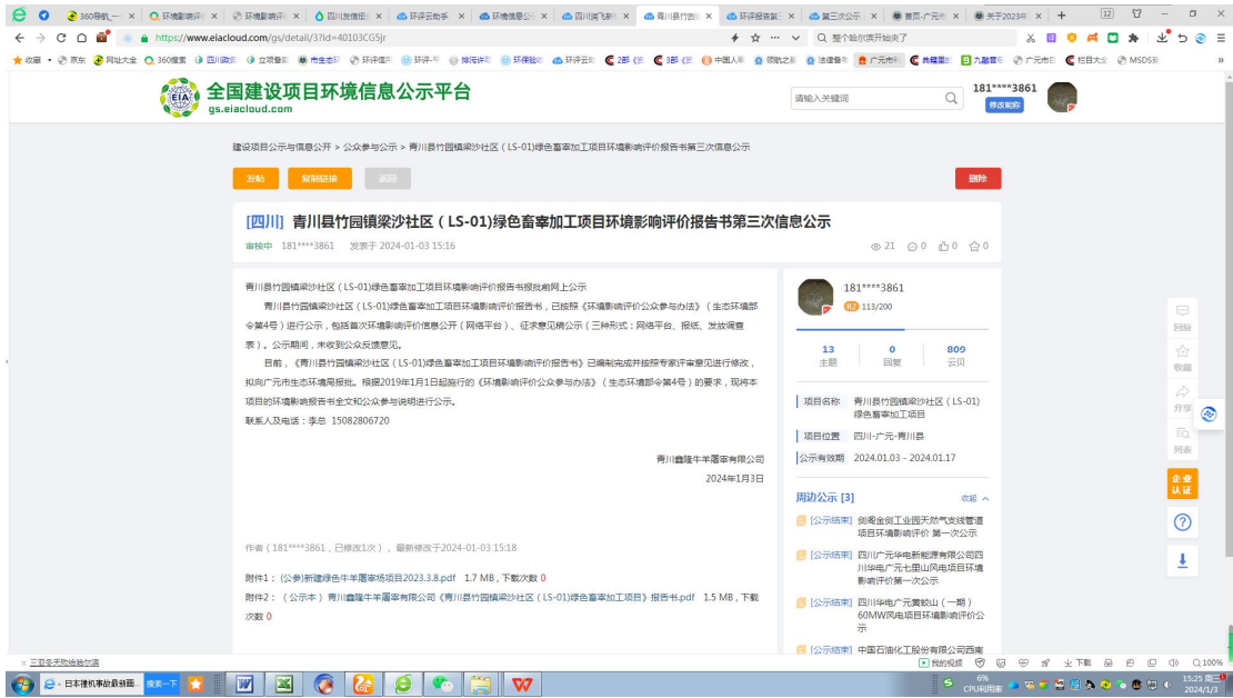
图 5 报批前网络公示截图