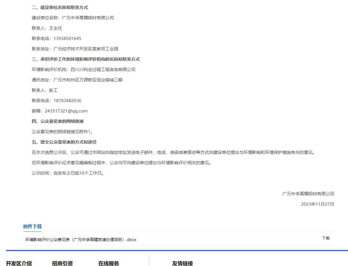
图 2-2 第一次公示图