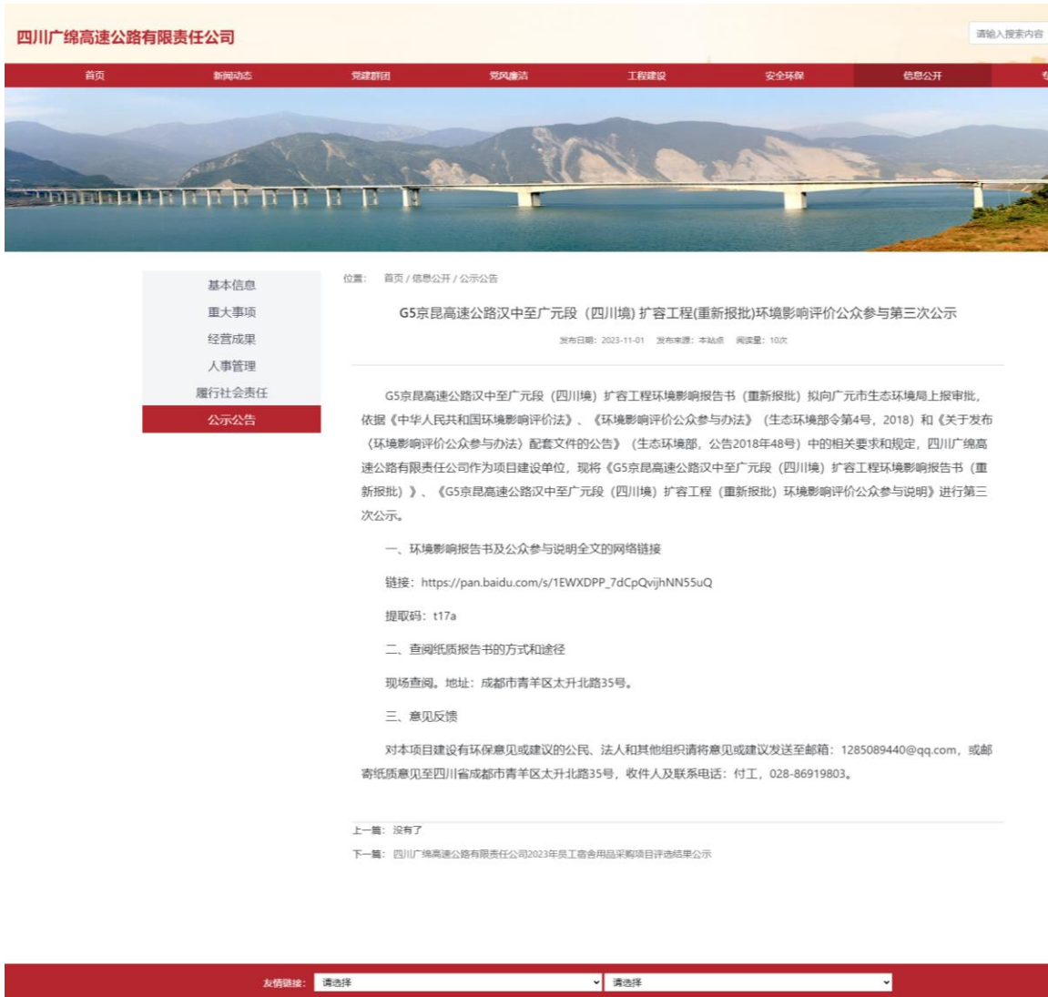
图 4-1 本项目环境影响评价第三次公示网络截图

和公众参与说明，公示链接为 https://gmgs.scgs.com.cn/content/136413.html 。公示截图如图 4-1。