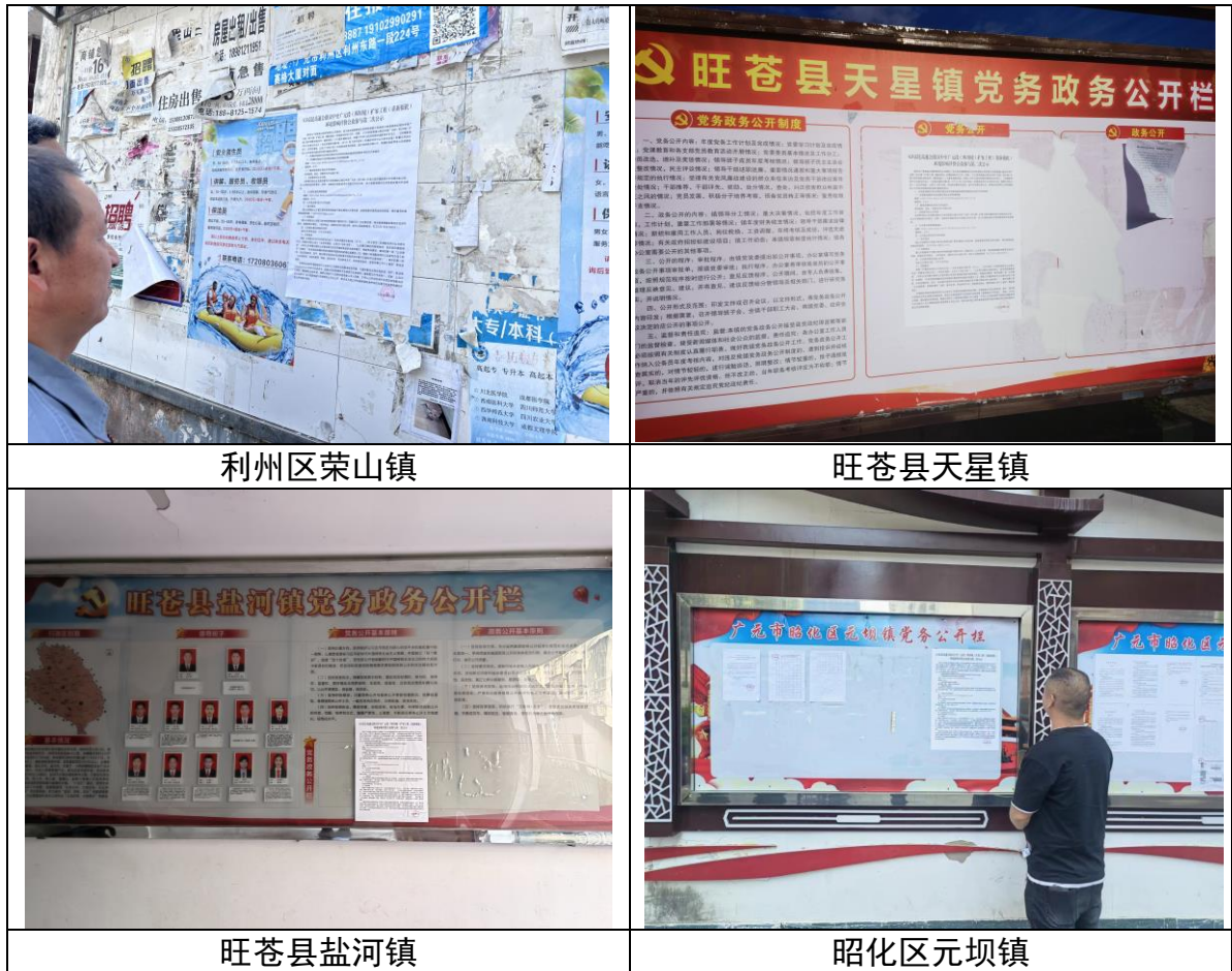
图 3.2-4 2023 年 8 月征求意见稿公示张贴照片