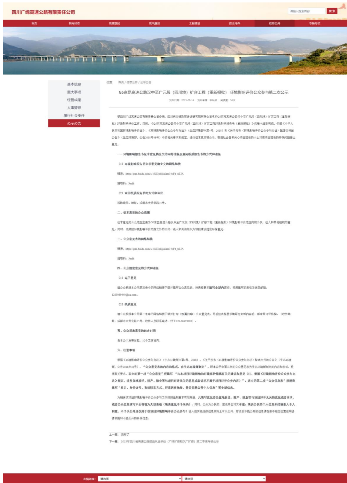
图 3.2-1 本项目环境影响评价第二次公示网络截图

https://gmgs.scgs.com.cn/content/131919.html。载体选择和公示时限符合《环境影响评价公众参与办法》（2018年部令第4号）要求，网络公示截图详见图3.2-1。