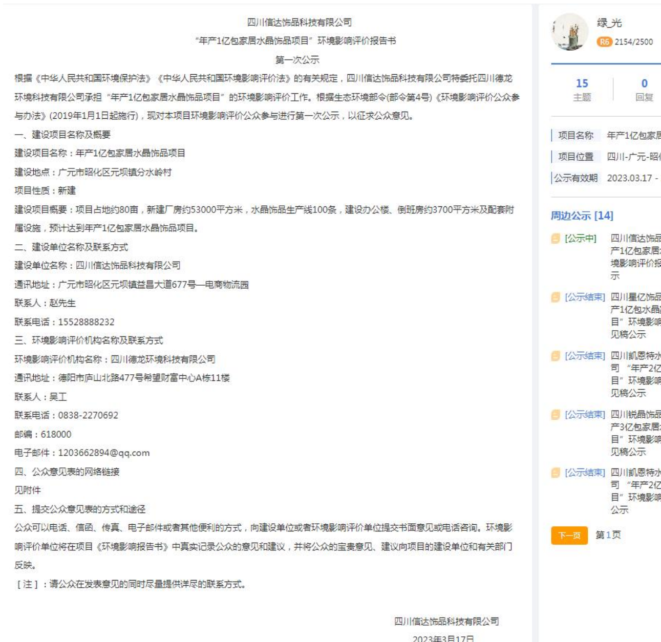
图 1 项目第一次网络公示图片