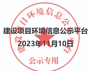
图 1 项目第一次网络公示图片