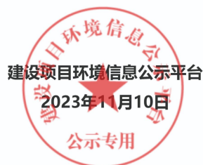
图 2 项目第二次网络公示截图