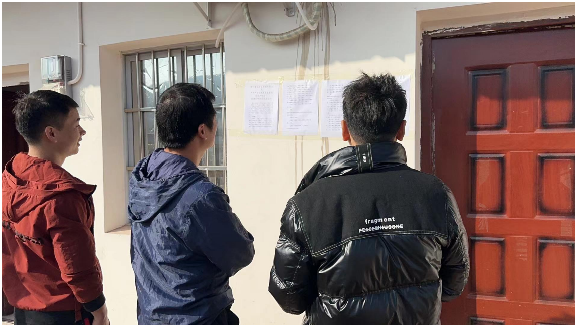
图5 项目现场张贴公示