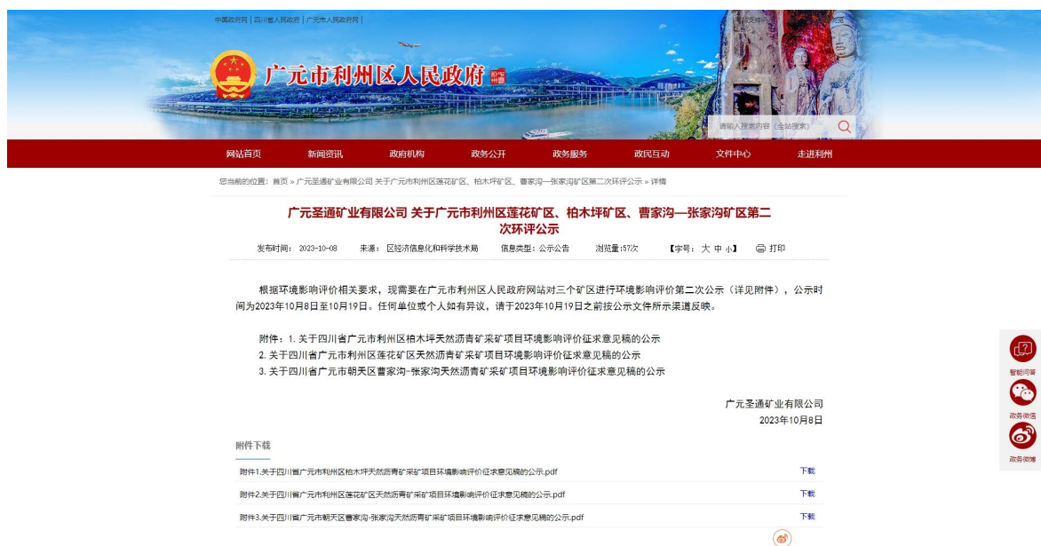
图 3-1 征求意见稿网络公示截图

本项目于2023年10月8日在广元市利州区人民政府网站（ http://www.lzq.gov.cn/news/show/20231009154547771.html ）对《广元圣通矿业有限公司关于四川省广元市利州区莲花矿区天然沥青矿采矿项目环境影响评价征求意见稿的公示》进行了征求意见稿网络公示，公示内容见图3-1。