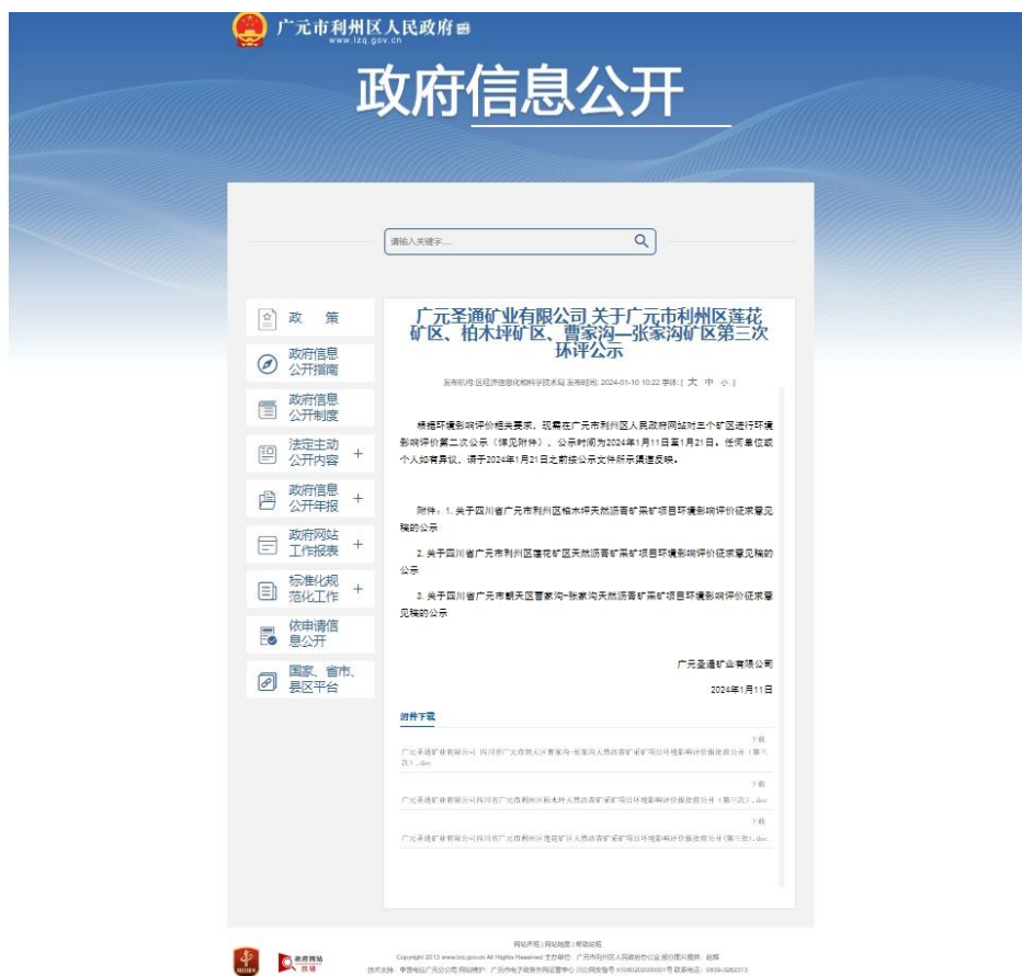
图 6-1 报批前公开截图