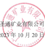
图 8-1 诚信承诺