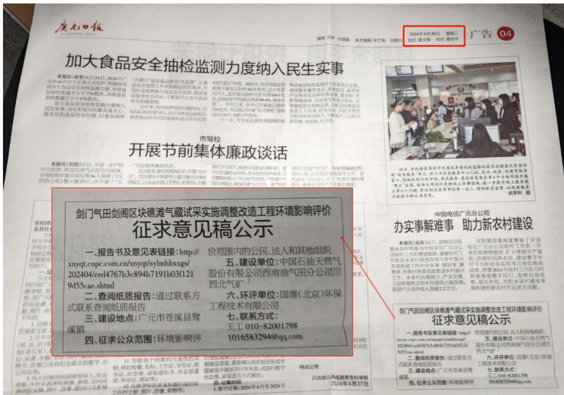
图4 第二次报纸公示