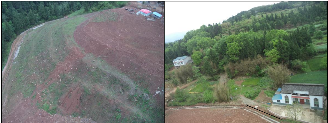
弃土场植被恢复现状

目前，通过自然恢复，主要是弃土夹杂的草种及周边草种随风飞播方式，弃土场边坡已经恢复了植被，植物以杂草为主，堆积面平整，处于培育地力待耕阶段。现场发现边坡有较为明显的水蚀痕迹，但作用强度较小。无大的环境问题，现场情况如下图所示。