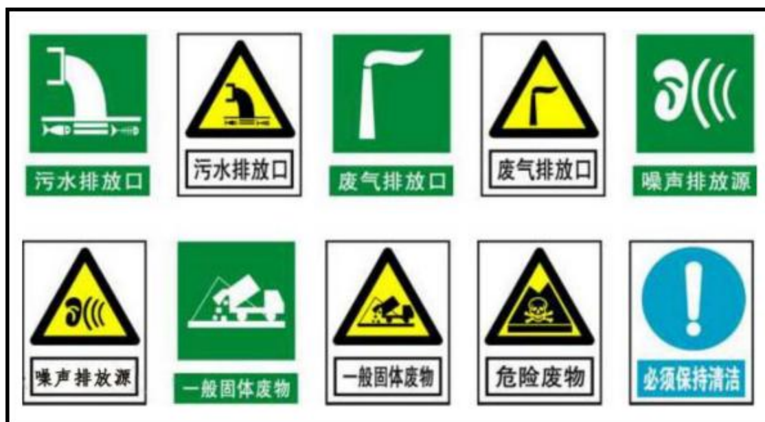
图 7-1 排污口图形标志示例